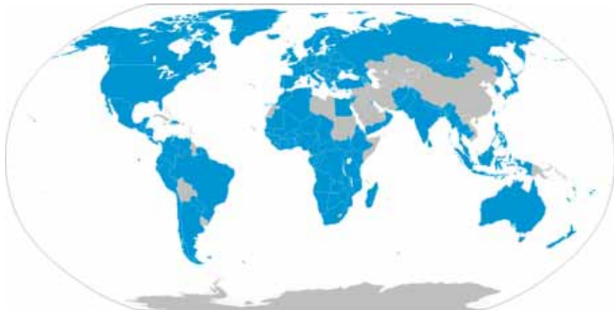
Халқаро касаба уюшмалари конфедерациясига аъзо мамлакатлар харитаси.