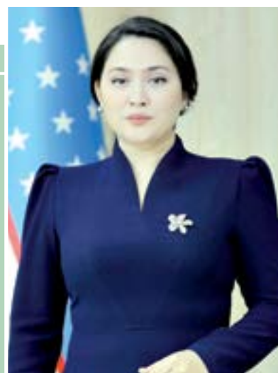
Hilola UMAROVA, maktabgacha va maktab ta'limi vaziri