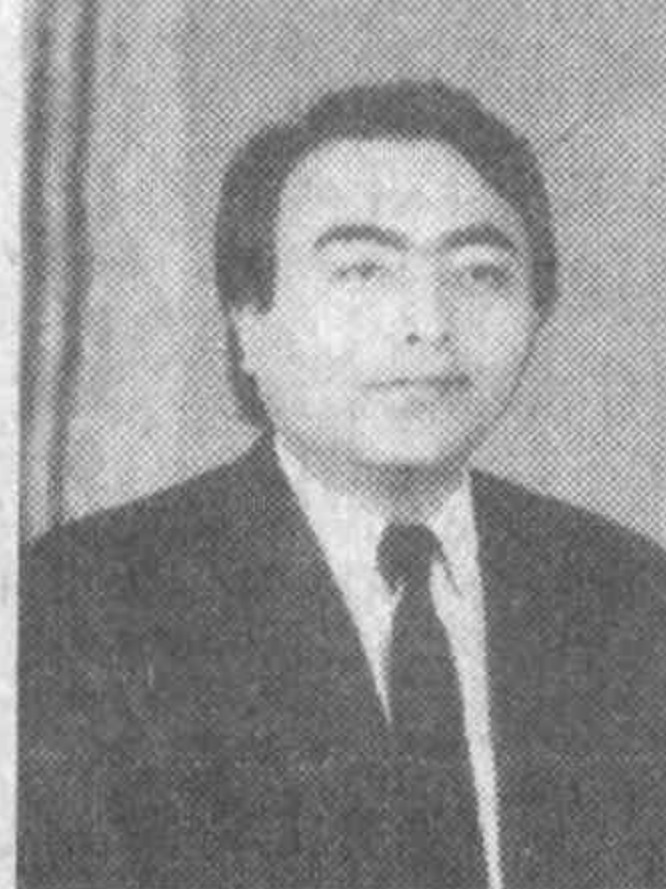
«Қўқон ушшоғи» каби кўшиқлари билан кўзга таш...