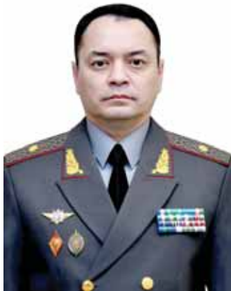
Шуҳрат ХОЛМУҲАМЕДОВ, Ўзбекистон Республикаси мудофаа вазирлиги генерал-майор.

зиммаидаги муқаддас бурчи бажариш борасида мураккаб синовлар ва тажриба орттириш йили бўлди. Мудофаа вазирлиги кўшинлари шахсий таркиби халқимиз тинчлиги ва фаровонлигини таъминлаш, оёсайишта ҳаётини ҳимоя қилиш бўйича муҳим вазифаларни шараф билан бажарди. Мамлакатимиз мудофаа салоҳиятини янада мустаҳкамлаш мақсадида кўшинларнинг жанговар шайлигини, ахлоқий-руҳий тайёргарлиги ва ватанпарварлик руҳини оширишга алоҳида эътибор қаратилди, касбий маҳоратини янада кучайтиришнинг янги тизими жорий этилди.