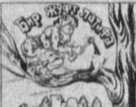
— Менга қаранг, сеньор, машинамизни сотиб олаётганимизда, «Хотиржам бўлаверинг, бир йил мобайнида нима нарсанинг бузилиб ё синиб қолса, алмаштириб бераман» деб ваъда қилганимиз-а?

Муаллиф танқидчидан сўради: — Пьесамга бирон-бир ўзгаришлар киритсаммикин? Сиз нима маслаҳат берасиз? — Ҳа, албатта. Мен асарининг қаҳрамони ўзини ўзи осмасдан, отишини маслаҳат берардим. — Нима учун? — Шунда ўқ товуши мудраб ўтгарган томошабинларни уйғотиб юборарди.