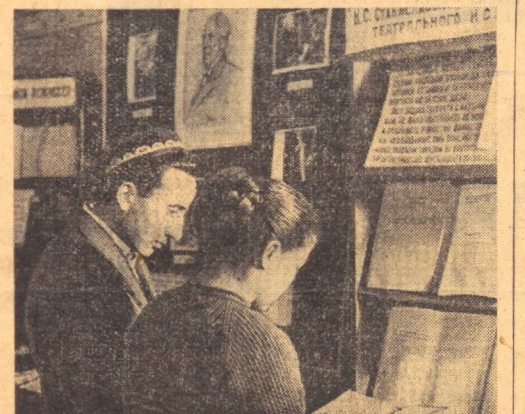
Пойтахтдаги Алишер Навоий номида Ўзбек Давлат халқ кутубхонасиде К. С. Станиславский тўғилган кўнининг 100 йиллигига бағишланган выставка очилди...