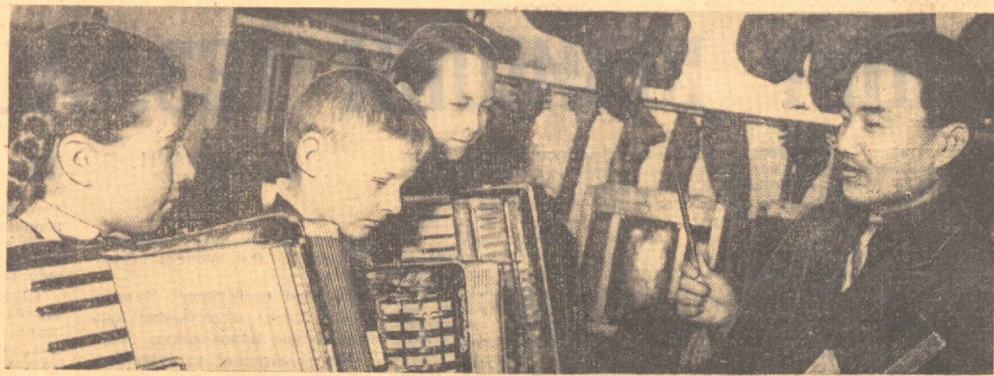
Пойтахтдаги Крупная номида пионерлар саройининг ношдаги халқ чоғу асослари ва анжордион тўғайларига 200 га яқин музика ишчибози катнашди...

Бўка районидида Оқуобов номида колхознинг иккинчи участкасиде яшовчилар.