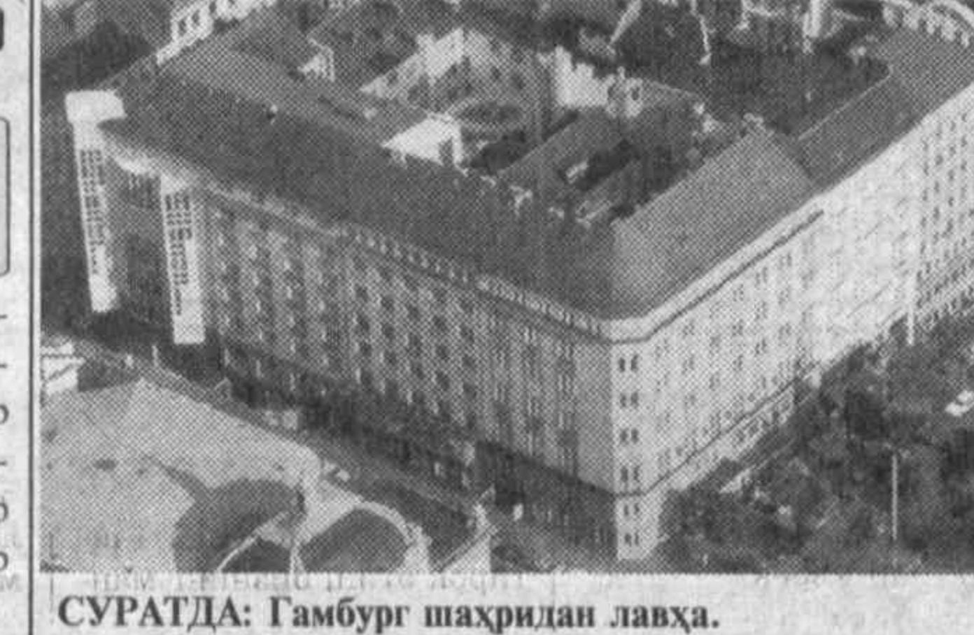
СУРАТДА: Гамбург шаҳридан лавҳа.

Чунки америкаликлар жорий йилнинг септатинчи қишига кўниқиб қолган. Бироқ айнан яқшанба куни Нью-Йорк яқинидаги Гудзон шаҳрида ёққан 166 сантиметр қалинликдаги қор мамлакатнинг йирик шаҳри тарихидаги энг қалин қор сифатида қайд этилди. Мутахассислар шу вақтгача 1948 ва 1949 йилларни энг серқор йиллар сифатида эътироф этишарди.