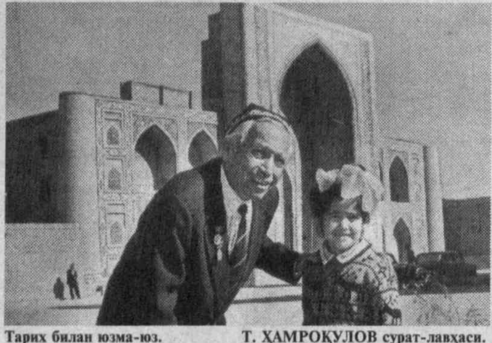
Тарих билан юзма-юз.

• Ўзбекистон оёқлар тер- ма жамоаси Ташкентнинг Чанг-Май шаҳрида ўтказил- ган Федерациялар кубоги учун Осиё-Океания минтақа- си иккинчи гуруҳи мусоба- баларида Океания ва Бру- ней теннисчиларини бир хил ҳисобда (3:0) маглубитга уч- радди. Яқин финалда эса хо- мюртларини Янги Зеландия терма жамоасига нўқзиб қўйишди.