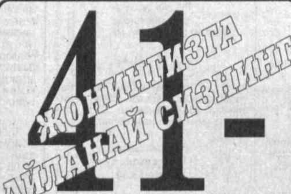
Ўзбекистон хотин-қизларига байрам тилаклари

Ҳеч бўлмаганда бир оғиз ширин сўзи, табриги билан кўнглингизни олар. Мен ҳам кўнглимдаги тилакларимни билдириб қўймоқчиман.