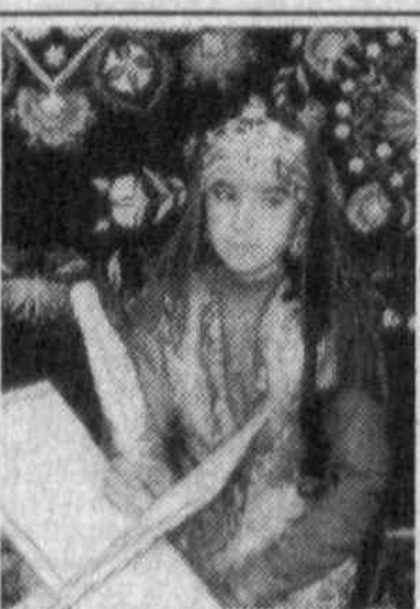
Сизга шеър ёзгим келди...