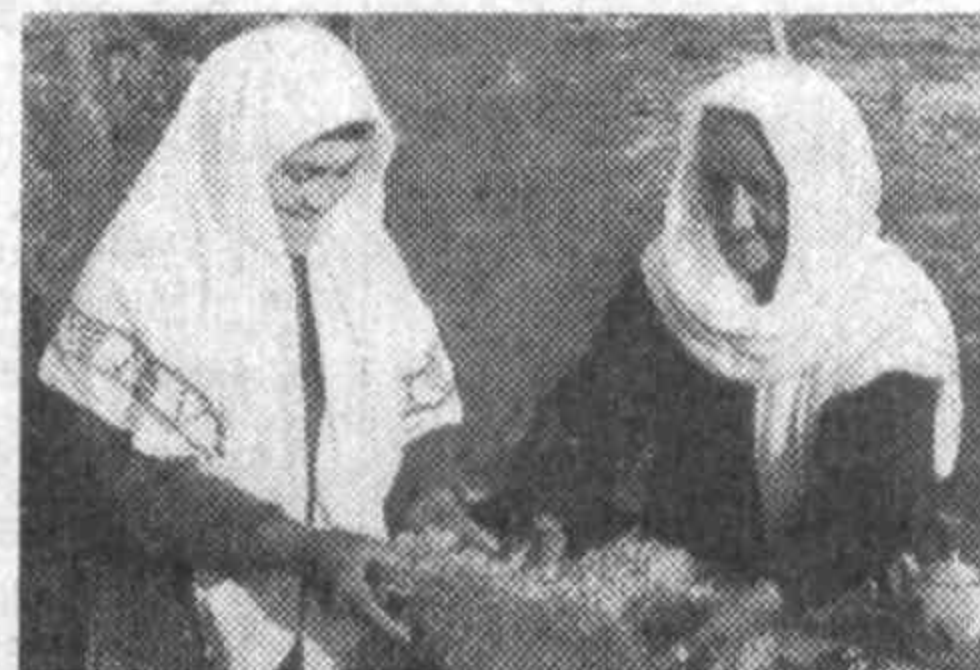
зоти борки, сиз ҳақингизда шеър ёзади, хонандаси ашула айтади. Мен ҳам таърифнинг битмакка сўз, ҳуснингиз томошасига сўз ахтараман.

Сиз ёрут дунёнинг зеб-зийнатисиз. Яратган бор меҳр-муҳаббатини сизга берган. Шунинг учун сизни ойда, гулга, сарвга, сўмбўлга, юлдузга, қўйингки, нима гўзал бўлса ўшанга ухшатадилар. Шоир