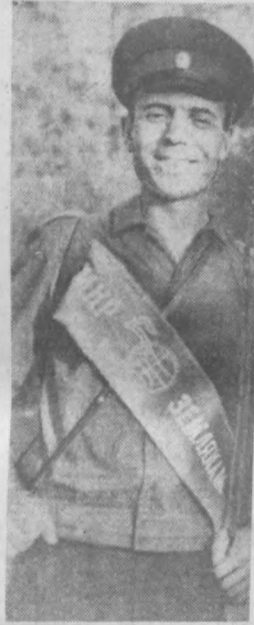
Р. БИБИШЕВ. Фото автора.