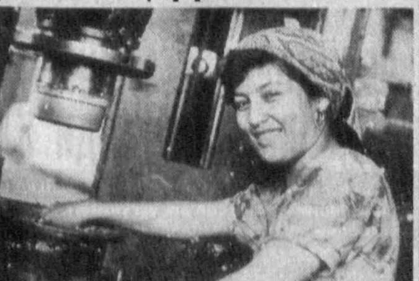
Қувасой шаҳридаги Исофайрам ҳиссодорлик жамияти қорхонасида ишлаб чиқарилдиган чинни чойнак, пилла, лаган ва шунингдек, турли хил соғабот буюмлар нафислига ва юксак сифати билан ажралиб туради. Шу боис бу ерда тайёрланадиган маҳсулотлар нафақат юртимизда, ҳамдаустлик мамлакатлари, қатор хорижий давлатларда ҳам харидовчиларга манзур бўлади.

Бўхоро туманидаги Обид Убайдон номли жамоа ҳўжалигининг Янгиобод қишлоғида «сантори олов» ёни. Шу тариқа туманда табиий газдан баҳраманд бўлмаётган биронта қишлоқ ёки хонадон қолмади. Бунинг учун қисқа муудатда 700 километр узунликда газ қувури тортинди. Эндилкида аҳолининг тоза ичимчи сув билан тўла таъминлаш ишлари авж олдириб юборилди.