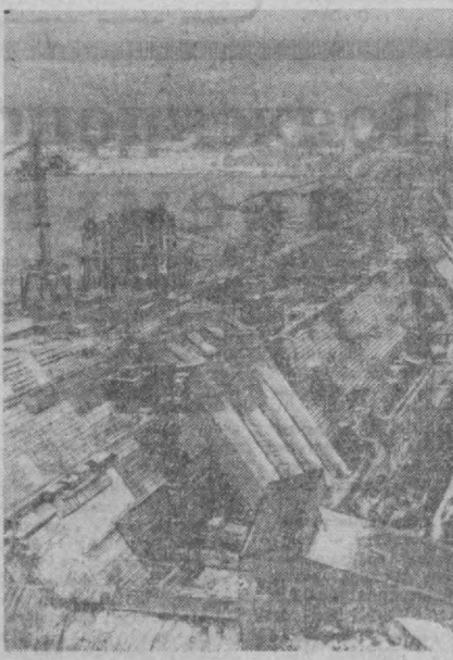
ДИВНОГОРСК, КРАСНОЯРСКАЯ ГЭС.