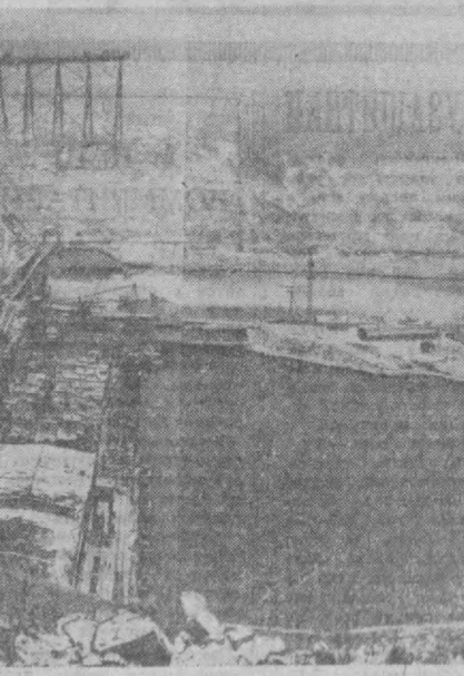
ДИВНОГОРСК, КРАСНОЯРСКАЯ ГЭС.

Видения смотрит более В связи с предстоящим ростом спроса на телевизоры для удобства покупателей, особенно для тех, кто получил квартиры в новостройках массовых жилищных массивов, где пока еще нет специализированных радиомагазинов, выделяется передний магазин-автомобиль.