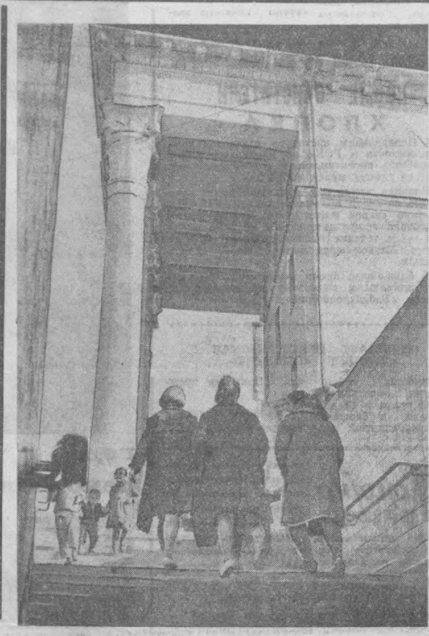
На площади Бируни сдан в эксплуатацию новый подземный переход.

НА СНИМКЕ: вид на новый подземный переход.