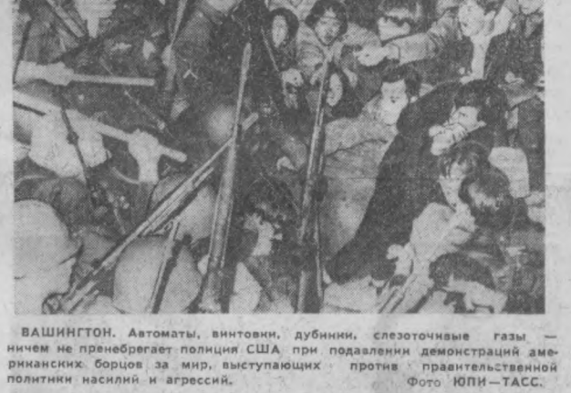
ВАШИНГТОН. Автоматы, винтовки, дубинки, слезоточивые газы — ничем не пренебрегает полиция США при подавлении демонстраций американских борцов за мир, выступающих против правительственной политики насилья и агрессии.