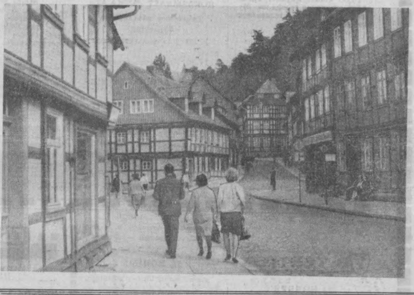
ГДР. Вернигероде, исторический центр графства Гарц, один из красивых старинных городов.

Эль РАЙ, индийский журналист, Бомбей. (По телефону). (АПН).