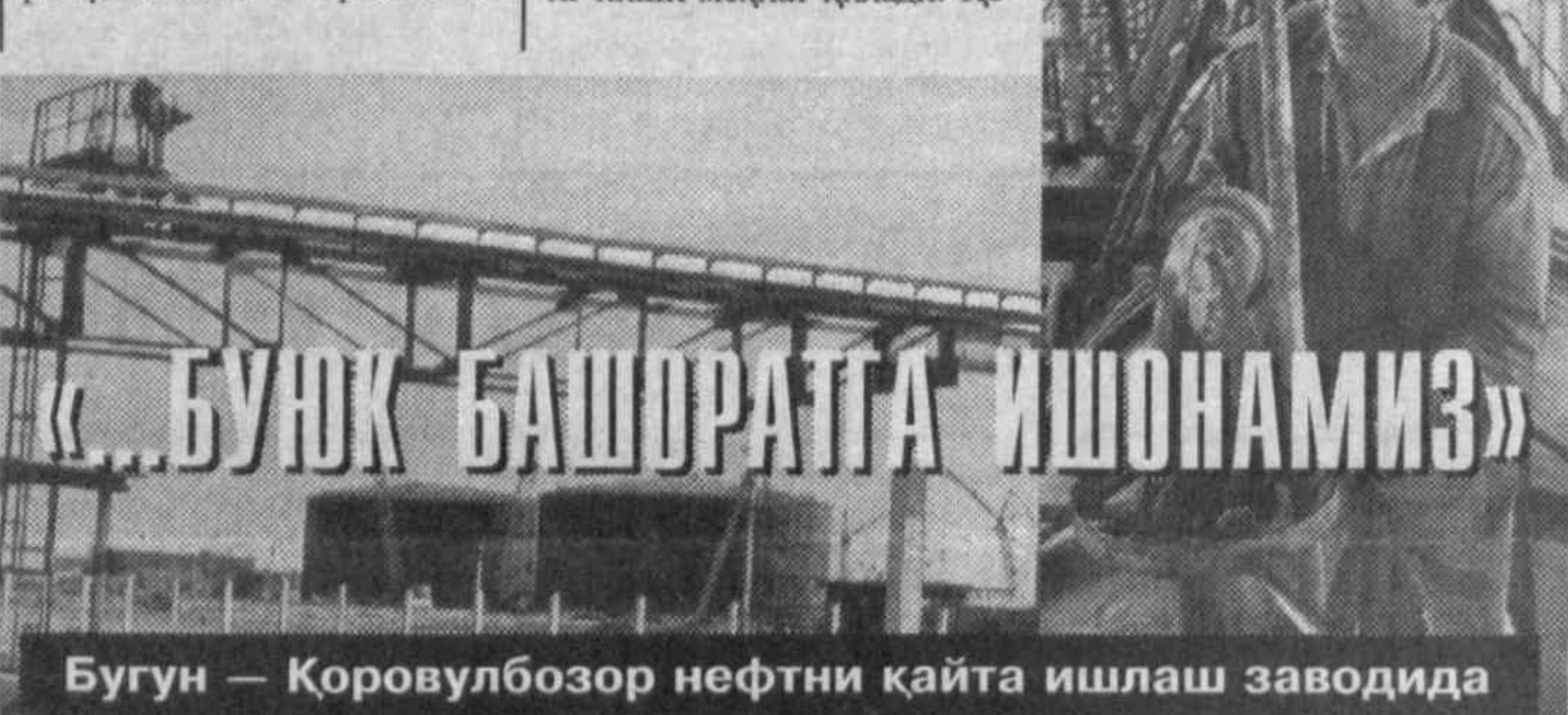
Бугун — Қоровулбозор нефтни қайта ишлаш заводида

вақтнинг ўзида тупроқ ишлари ҳам амалга ошириляпти.