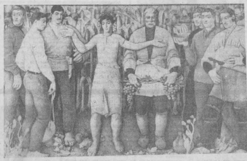
«ЗЕМЛЯ ГРУЗИНСКАЯ». Картина заслуженного художника Грузинской ССР К. М. Махарадзе.