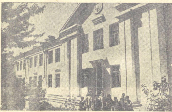
Тошкент шаҳар, Октябрь районидagi 75-чи мактаб биноси янги ремонтдан чиқарилиб, янги ўқув йилига тахт қилиб қўйилди. Суратда: 75-чи мактаб биноси, Унда: Урта Осие давлат университети биноси олдидан.