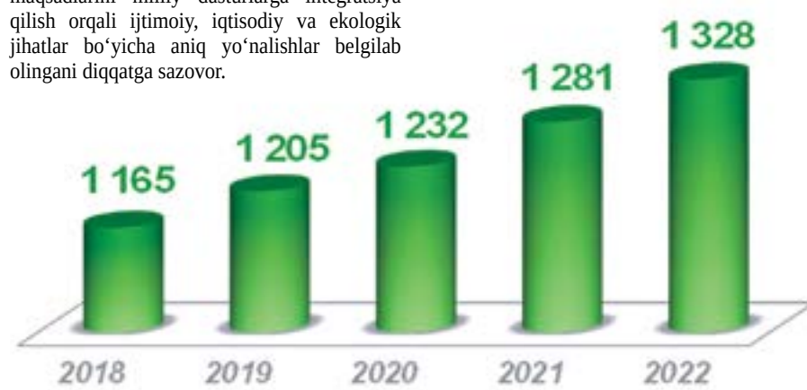
O'zbekiston Respublikasida tibbiyot muassasalari soni (tegishli yilning 1-yanvar holatiga, birlik)

BRM mamlakat kelajagini belgilaydigan asosiy strategiyalardan biridir. Shu ma'noda, 2030-yilgacha bo'lgan Barqaror rivojlanish maqsadlarini milliy dasturlarga integratsiya qilish orqali ijtimoiy, iqtisodiy va ekologik jihatlarni bo'yicha aniq yo'nalishlar belgilab olingani diqqatga sazovor.