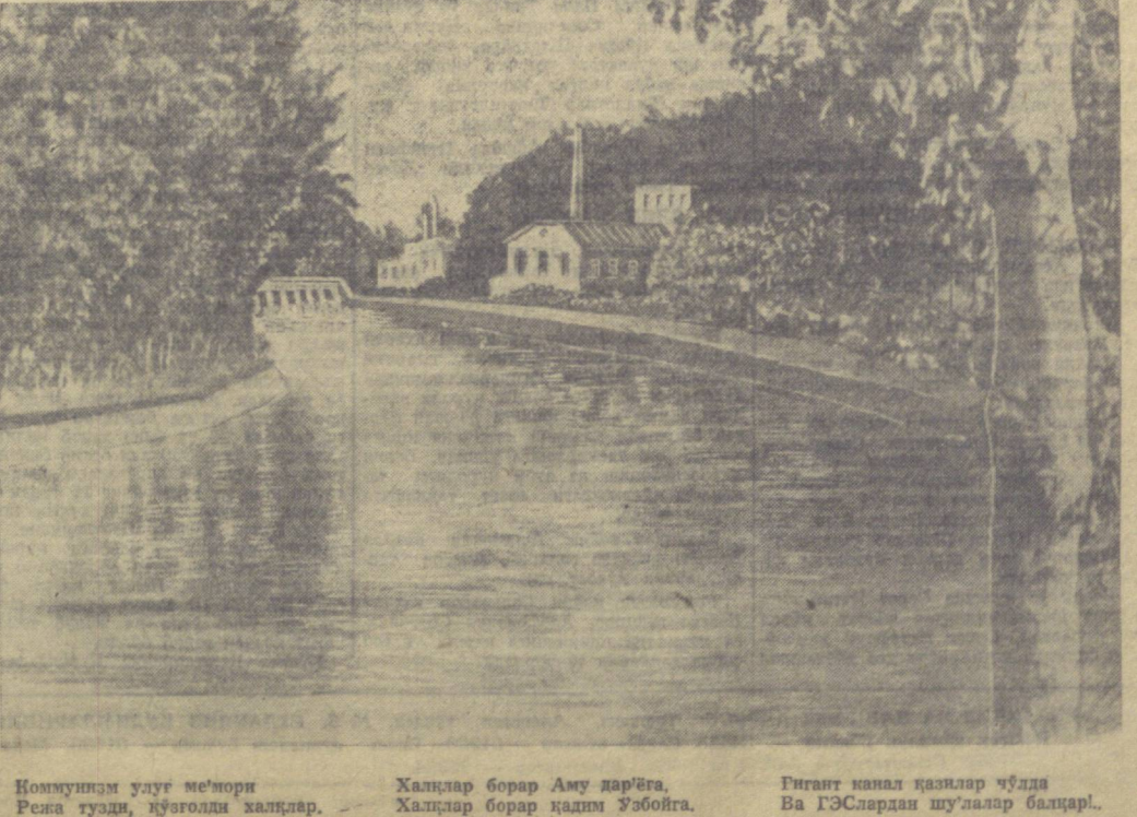
Коммунизм улғун меъори Режа тузди, қўнғини халқлар. Халқлар борар Аму дарёга, Халқлар борар қадим Ўзбойга. Гинант канал қанқини қўнғини Ва ГЭСлардан шулар балқар.

Сталиннинг буюқ иродаси билан яратилган бу иншоотлар бизнинг илғини асринидадан ештан коммунизм асрининг ялғонларига мухофотдир!