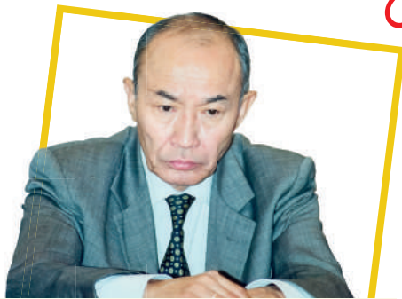
Abdulla ORIPOV, O'zbekiston Qahramoni, xalq shoiri