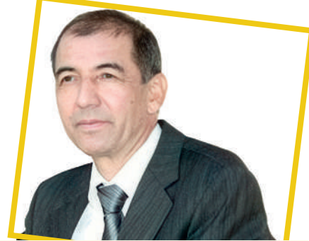
Sirojiddin SAYYID, O'zbekiston xalq shoiri