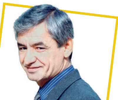
Muhammad YUSUF, O'zbekiston xalq shoiri

Men nechun sevaman O'zbekistonni, Tuprog'in ko'zimga aylab to'tiyo. Nechun Vatan, deya yer-u osmonin, Muqaddas atayman, atayman tanho. Aslida dunyoda tanho nima bor? Paxta o'smaydimi o'zga elda yo? Yoki quyoshimi sevgimga sabab? Axir quyoshli-ku, butun Osiyo. Men nechun sevaman O'zbekistonni, Bog'larin jannat, deb ko'z-ko'z etaman. Nechun ardoqlarkan tuprog'ini men, O'paman, tuprog'ing bebaho, Vatan! Aslida tuproqni odil tabiat, Taqsim aylagan-ku, Yer yuziga teng Nechun bu tuproq, deb yig'ladi Furqat, O, Qashqar tuprog'i, qashshoqmiding sen? Men nechun sevaman O'zbekistonni? Sababini aytgin, desalar menga. Shoirona, go'zal so'zlardan oldin, Men ta'zim qilaman ona xalqimga: Xalqim, tarix hukmi seni agarda, Mangu muzliklarga etgan bo'lsaydi, Qorliklarni makon elgan bo'lsayding, Mehrim bermasmidim o'sha muzlarga? Vatanlar, Vatanlar, mayli, gullasin, Bog' unsin mangu muzda ham, ammo, Yurtim, seni faqat boyliklaring chun Sevgan farzand bo'lsa, kechirma aslo!