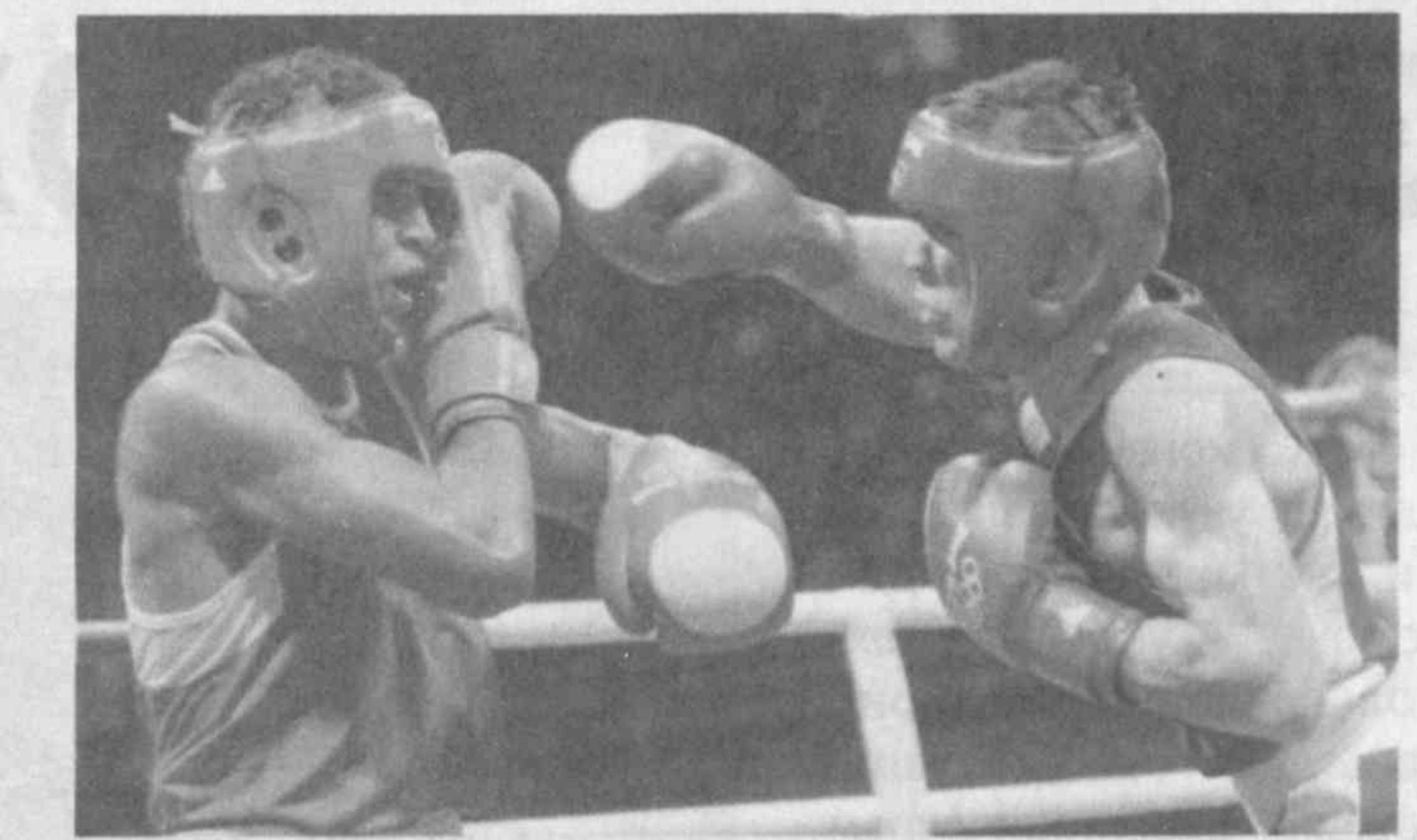
Йили бўладиган мусобақаларда ҳам совриндорлар сафидан жой олишни мақсад қилиб қўйганмиз.