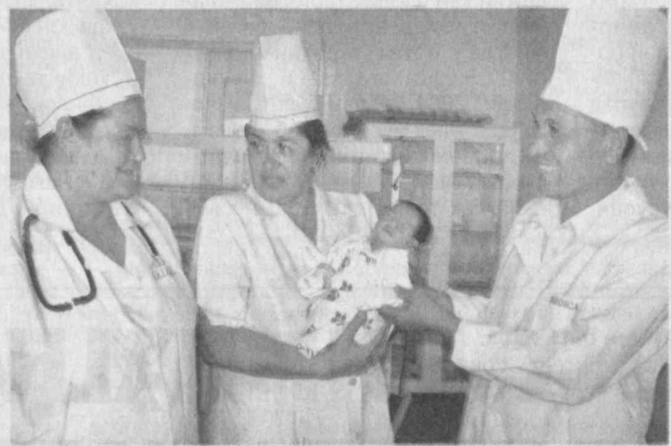
Наврўзова. — Бу ҳамкорлик яқини самара келтираётир. Мўҳими, мазкур хайрли иш давом этмоқда. Чунонки, Баркамол авлод йилида Шофиркон туманидаги "Негкиши" қишлоқ врачлик пункти ҳам ота-қачқа олиб, уни энг намунали қишлоқ шифо масканига айлантириш юмушларини бошлаб юбордик. Ҳа, ҳозир вилоятнинг қайси қишлоғига борманг, эл саломатлиги масаласига катта эътибор қаратилаётганининг гувоҳи бўласиз. Ҳатто, энг чекка ҳудудларда ҳам аҳоли учун тиббий хизмат кўрсатиш даражаси ошиб бораёпти.

Дарҳақиқат, қишлоқ врачлик пунктларининг кўркам, замонавий биналарга эга бўлаётгани, энг сўнгги рўсумдаги тиббий техника воситалари билан таъминланаётгани, олимлар ва қишлоқ шифокорларининг ҳамкорлиги эл саломатлиги муҳофазасида жуда катта аҳамият касб этаёпти. Биргина 2009 йилда шаҳар ва туман марказларидан олинсадаги қишлоқ шифо масканлари 15 та "Дамас" русумли машина билан таъминланди. "Тез ёрдам" хизматида вилоят ҳокимлиги ташаббуси билан ҳомийлар томонидан 11 автоулус ажратилди. Йигирмата қишлоқ врачлик пункти эса энг намунали шифо масканига айлантирилди. Буларнинг барчаси мамлакатимизда инсон саломатлигига давлат сийосати даражасида эътибор бериллаётганининг самарасидир, албатта.