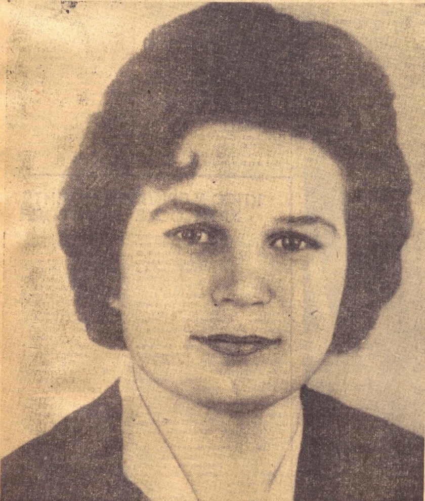
Валентина Владимировна ТЕРЕШКОВА.

Идеология ишларининг савия- сини коммунистик қурилишнинг ҳозирги юксак талаблари ва улуг- вор вазифалари даражасига кўта- райлик!