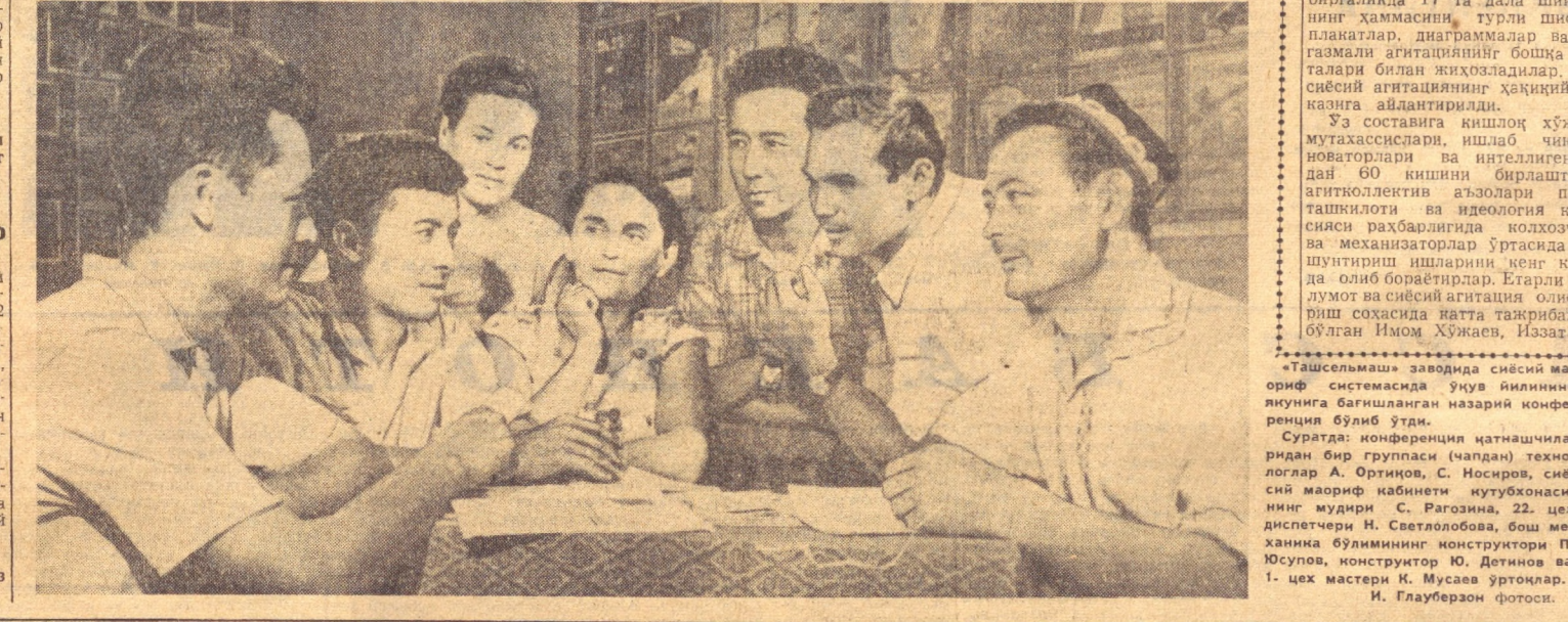
«Ташсельмаш» заводда сийёсий маориф системасида ўқув йилининг якунига бағишланган назарий конференция бўлиб ўтди.

Каттақўрғон шаҳрида сийёсий ва илмий билимлар тарқатувчи жамоатчилик шаҳар бўлими 12 кишидан иборат атеистлар секцияси ташкил этган.