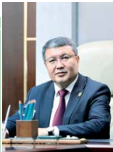
Akbar TOSHQULOV, adliya vaziri