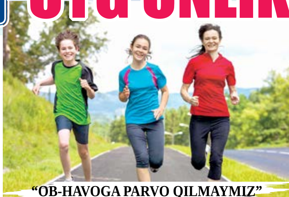
"OB-HAVOGA PARVO QILMAYMIZ"

bu harakatlar bizga taraqqiyot mahsuli bo'lgan barcha qulayliklardan chekinib, tabiiylik sari yuzlanishga undagan muvozanatni eslatdi. O'zaro insoniy munosabatlar, intilishlar, maqsad sari kurashlar, yo'ldagi to'siqlar va uni yengib o'tish borasidagi yechimlar ana shu harakatlar silsilasida ko'z oldimdan o'tdi. Ajab manzara. Beixtiyor kayfiyat ko'tariladi. Axir bu insonlarning har biri salomatlikka, jismonan yetuklikka intilmoqda. Ruhaniyat va ma'nan bardamlikka ehtiyoji bor. Bir-biriga mullatqo begona insonlarning erta tongdan bir joyda jamlanishi, muloqot qilishi, tabiat qo'ynida jismoniy, o'z o'rnida ruhiy tarbiya bilan mashg'ul bo'lishi zamirida ana shu ehtiyoj ustuvor ekanini his qilish qiyin emas.