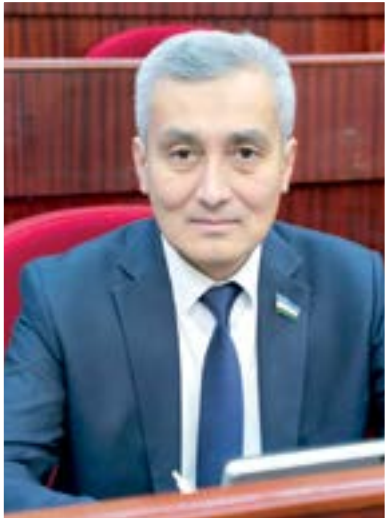
Azamat PARDAYEV, Oliy Majlis Qonunchilik palatasi deputati