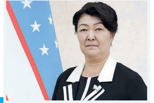
Гулжан ХАЛМУРАТОВА, Олий Мажлис Қонунчилик палатаси депутати, O'zLiDeP фракцияси аъзоси