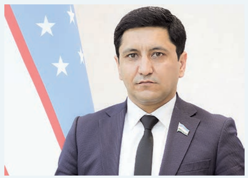
Жасур ЖУМАЕВ, Олий Мажлис Қонунчилик палатаси депутати, O'zLiDeP фракцияси аъзоси

Юртимизда ижтимоий адолатни таъминлаш, ижтимоий ҳимояга муҳтож ва ногиронлиги бўлган шахсларнинг ҳуқуқ ва эркинликларини кафолатлашга катта эътибор қаратиляпти. Бу ўзгаришлар орқали мамлакат ижтимоий давлат сифатида янги босқичга ўтди.