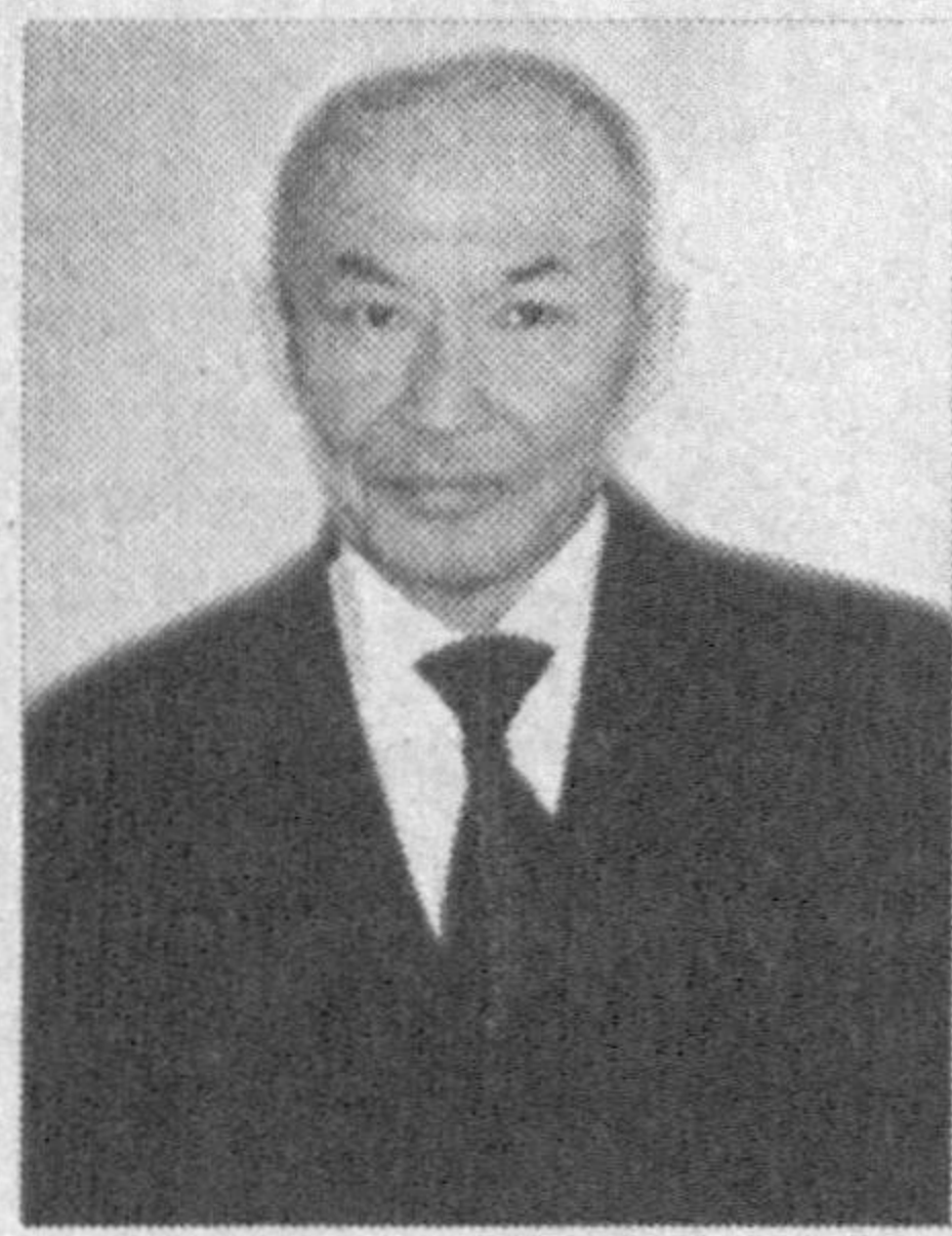
Абдулла ОРИПОВ, Ўзбекистон Қаҳрамони, Халқ шоири

Бирингиз туну кун тарқатиб миш-миш, Дўстларим орасин бузганлардан доғ. Бирингиз қўлимдан еб туриб эмиш, Нишонч ришталарин узанлардан доғ.