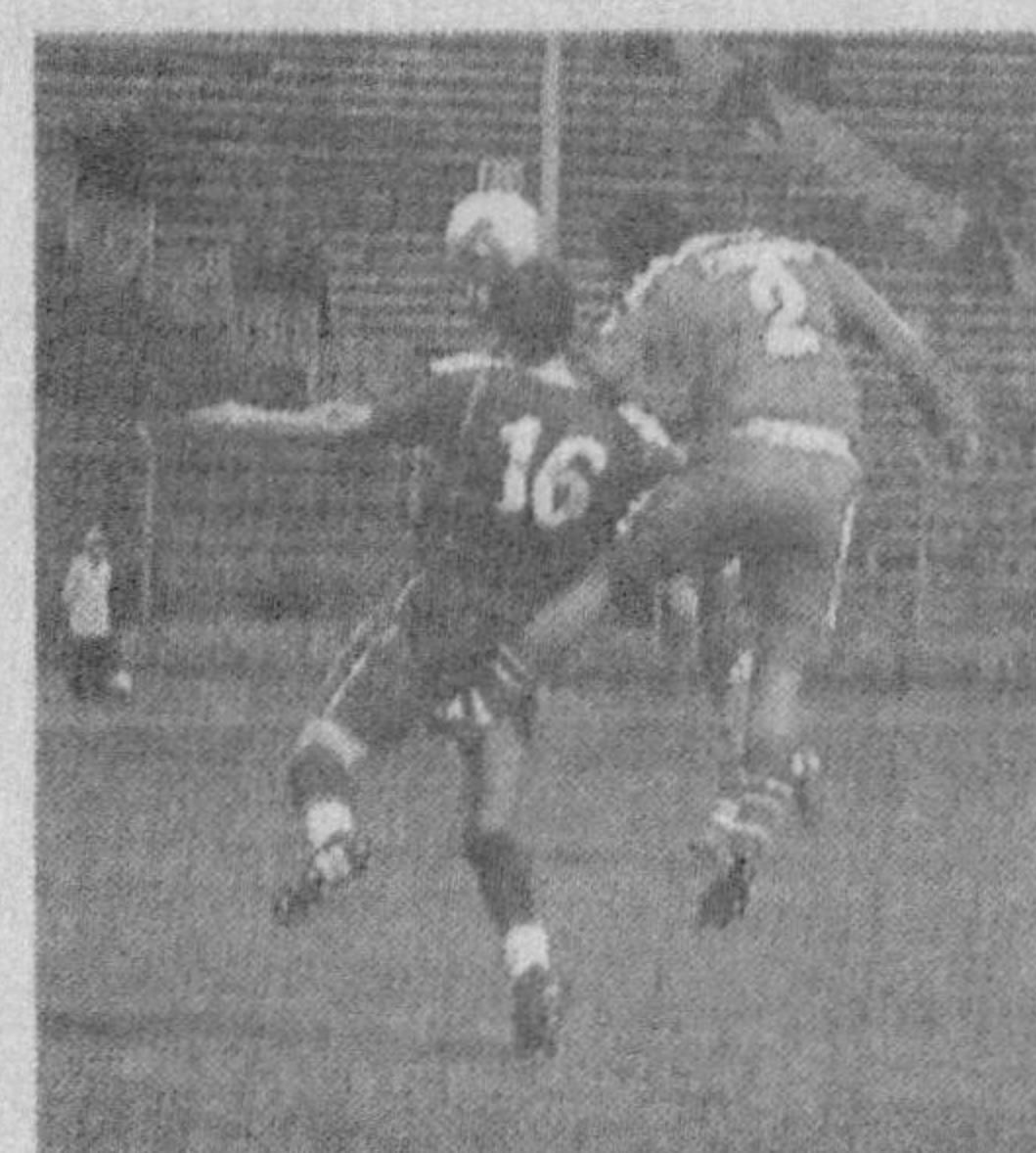
Унда ҳамюртларимиз Таиланд терма жамоасига қарши майдонга чиқдилар. Агар бу учрашувда таиландликлар галаба

Осиё чемпионати саралаш баҳсларида қатнашаётган Ўзбекистон миллий терма жамоаси мuddатдан илгари мусобақанинг финал босқичига йўлланма олганлигини аввал хабар қилгандик. Кеча футболчиларимиз саралаш босқичининг сўнгги тур учрашувини ўтказишди.