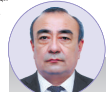
Хусан ЭРМАТОВ, Ўзбекистон Республикаси Олий Мажлиси Сенати аъзоси

Қуни кеча Ўзбекистон Республикаси Олий Мажлиси Сенати маъқуллаган қонун ҳам икки халқнинг узок йиллик қутган орзу-истакларини ўзида намоеън этди. Бу қонундан ҳар икки халқ бирдек манфаат топиши, шубҳасиз.