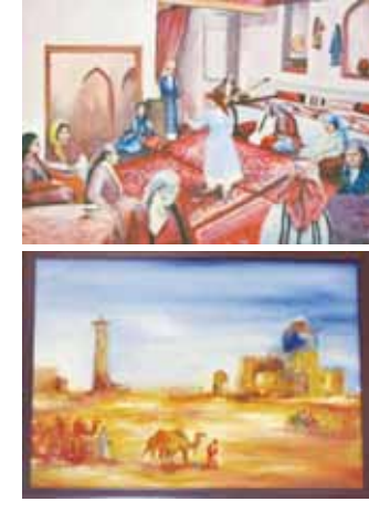
соми Тохун Кобаяши Ўзбекистон ўқувчиларининг ижодий машқларини алоҳида эътироф этди. "Токио шаҳри марказида жойлашган машур Миллий санъат саройида 22-бор ўтказилаётган "Санъат — чегара ошиб" номли расмлар кўргазмасининг "Болалар расмлари" қисмида намоийш қилинаётган Ўзбекистон мактаб ўқувчиларининг расмлари кўпчиликини қизиқтирмоқда. Ташриф буюрувчилар мазкур расмлар маҳорат билан чизилгани ва сермазун эканини таъкидламоқда. Ўзбекистон вакиллари кўргазмадаги иштироки учун миннатдорлик билдираман", деди у.

Ўзбекистон болалари расмларининг намоиши мамлакатимиз элчионаси томонидан Халқаро Сумие жамияти билан биргаликда уюштирилди. Ушбу кўргазмада 35 та мамлакатдан йиғилган 500 дан ортиқ санъат асарлари намоийш қилинмоқда. Ўзбекистон бурчаги Мактабча ва мактаб таълими вазирилик ҳузуридаги ИХТИСОСЛАШТИРИЛГАН ТАЪЛИМ МУАССАСАЛАРИ АГЕНТИГИ тизимидаги мактаблар ўқувчилари томонидан чизилган 30 та расм билан безатилди. Уларда юртимиз табиатининг гўзаллиги, маданий мероси, миллий либослари, тарихий ва диққатга сазовор жойлари тасвирланган. Кўргазмининг очилиш маросимида элчионамиз вакиллари Япониянинг марказий санъат саройларидан бирида бундай расмлар орқали юртимиз маданияти ва урф-одатларини япон томошабинига кенг намоийш қилиш имконияти яратиб берилган учун миннатдорлик билдирди. Шунингдек, халқаро кўргазмаларда иштирок этиш ўзбекистонлик ёшларнинг янада самарали ижод қилишига руҳлантириши ургуланди. Кўргазма ташкилотчиси, Халқаро Сумие жамияти раиси, таниқли япон рас-