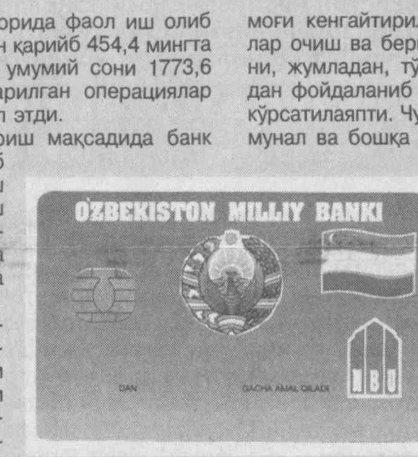
Миллий банк хозирги кунда «Western Union», «Migom», «Тезкор почта» ва «Азия Экспресс» тизимлари орқали, шу жумладан, «Contact», «Лидер» ва «Unistep» тизимларига кирган вакил банклар тармоғини фойдаланган ҳолда, халқаро пул жўнатмаларини амалга ошириляпти. Фақат 2009 йилнинг ўзида бундай операциялар умумий ҳажми 105,3 млн. АҚШ долларини ташкил этди. Шундан 91,4 млн. АҚШ долларини тўланган жўнатмалардир.

моғи кенгайтириляпти. Уларда жисмоний шахсларга омонатлар очил ва бериш, улардан коммунал ҳамда бошқа тўловларни, жумладан, тўлов воситаси сифатида пластик карточкалардан фойдаланиб қабул қилиш ҳамда бошқа шу каби хизматлар кўрсатиляпти. Чунончи, 2009 йилда жамғарма кассаларида коммунал ва бошқа хизматлар учун тўлов сифатида 90 млрд. сўм қабул қилинди. Бу эса, ундан аввалги йилнинг шу давридагига нисбатан 1,3 баравар кўп. Жумладан, 115 та мақсус кассада (шулардан 10 таси минибанклар) 67 млрд. сўм ҳажмидаги тўловлар қабул қилинди. Ҳам нақд шаклда, ҳам пластик карточкалардан нақдсиз тўлов йўли билан қабул қилинган бу маблаглар шундай тўловлар умумий ҳажмининг 63 фоизини ташкил этди.