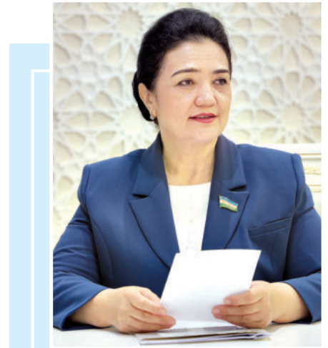
Мавлуда ХЎЖАЕВА, Олий Мажлис Қонунчилик палатаси Спикери ўринбосари

Умуман олганда, Ўзбекистон халқаро рейтинг ва индекслар билан ишлаш тизимини такомиллаштириш ва парламент назоратини кучайтириш орқали мамлакатнинг халқаро майдондаги нуфузини оширади албатта. Бунинг учун тизимли ёндашув, шаффофлик ва ҳамкорлик гоят муҳим. Парламентнинг фаол иштироки ушбу жараёнда ҳал қилувчи омилдир. Шу нуқтага назардан, Қонунчилик палатасидаги сиёсий партиялар фракциялари, кўмита ва комиссиялар ҳам бу борада ўзларининг соҳавий йўналишларидан келиб чиқиб, тегишли вазирлик ва ташкилотлар билан ҳамкорликда фаол ишлайди.