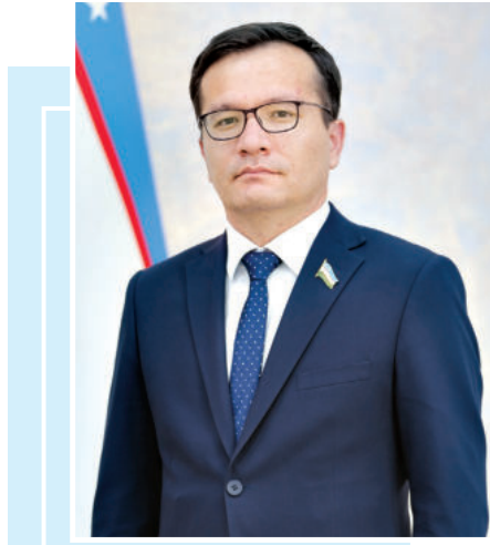
Дилмурод АРТИҚОВ, Олий Мажлис Қонунчилик палатаси депутати

Ўзбекистон мана шундай катта ва масъулиятни, шарафли вазифани зиммасига олар экан, янги тахрирдаги Конституциямизда бу тамойил мустақамлашиб, давлатнинг ижтимоий соҳадаги мажбуриятлари билан