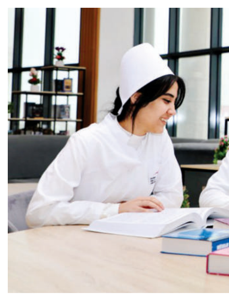
тинг ташкилоти Осиё университетларининг 2025 йил учун рейтинг натижаларига кўра, Қарши давлат университети 801-850, Марказий Осиё давлатлари орасида 55-ўринни эгаллади.

Бундан ташқари, дунёнинг етакчи олий таълим муассасалари ва илмий-тадқиқот институтлари билан яқин ҳамкорлик ўрнатиш ва уларда ўқитувчиларнинг стажировка ўташи ҳамда малакасини ошириш борасидаги ишларга алоҳида эътибор қаратилмоқда. 2024 йилда университетнинг 90 профессор-ўқитувчиси хорижда малака оширди, халқаро стажировкада бўлди. Бу кўрсаткич 2022 йилга нисбатан 5 баробар кўп эканини эътироф этиш мумкин. Эришилган натижалар сарҳисоби ўлароқ, 2024 йил 6 ноябрда эълон қилинган нуфузли халқаро Quacquarelli Symonds (QS) ре-