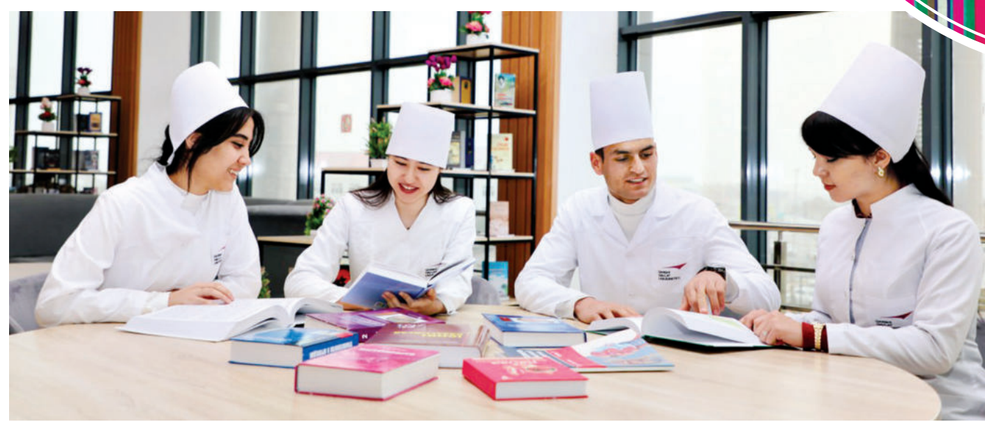
davlat universiteti 801-850, Markaziy Osiyo davlatlari orasida 55-o'rinni egalladi.

Bundan tashqari, dunyoning yetakchi oliy ta'lim muassasalari va ilmiy-tadqiqot institutlari bilan yaqin hamkorlik o'rnatish va ularda o'qituvchilarning stajirovka o'tashi hamda malakasini oshirish borasidagi ishlarga alohida e'tibor qaratilmoqda. 2024-yilda universitetning 90 professor-o'qituvchisi xorijda malaka oshirdi, xalqaro stajirovkada bo'ldi. Bu ko'rsatkich 2022-yilga nisbatan 5 barobar ko'p ekanini e'tirof etish mumkin. Erishilgan natijalar samarasi o'laroq, 2024-yil 6-noyabrda e'lon qilingan nufuzli xalqaro Quacquarelli Symonds (QS) reyting tashkiloti Osiyo universitetlarining 2025-yil uchun reyting natijalariga ko'ra, Qarshi