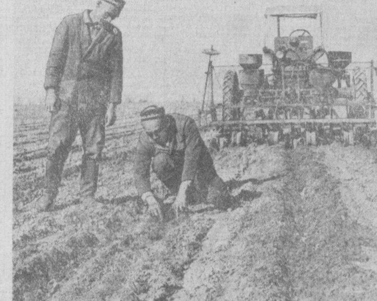
Уруғлик чигитни гоммоз ва илдиз чириш ҳасалигига қарши дориллаш уни экишга тайёрлашнинг энг муҳим босқичи ҳисобланади.