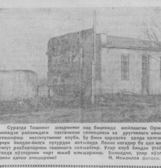
Суратда Тошкент шаҳрининг нақ биқинида жойлашган Оржоникидзе районидеги патхачилик селекциеси ва уруғчилик илмий текшириш институтининг клуби. Бу бино қаровсиз ҳолда қолгани учун қилдан-қилга пугурдан кетмоқда. Лекин негадир бу қол институт раҳбарларини ташвишга соймаптир. Улар клуб биндан ўтаётганда қўзларини кирт юйиб олшармиш. Ўйладик, улар қўзларини қачон очшармиш!