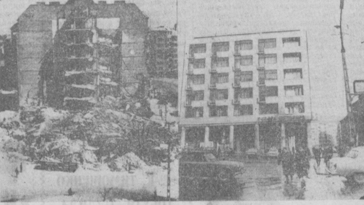
Фэшист босқинчиларидан овоз қилинган кундан кейин Венгрия Халқ Республикаси Мучеников проспекти билан Карол Келети кўчаси туташган жой, (қалда 1945 йилнинг бошларида, унда эса 1970 йилдаги кўриниши).