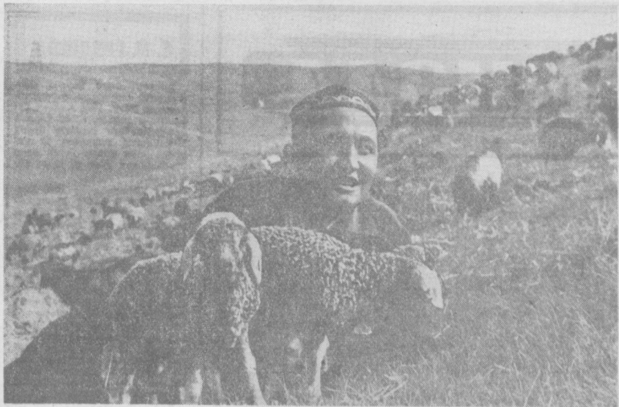
Сирдарё областидаги 2-«Земин» совхозининг чорвадорлари кўз-назорат кампаниясини муваффақиятли ўтказишди. Бу ерда маълум 16 миң соғилниң берилди. Ҳаммаси қўзилаб бўлади.