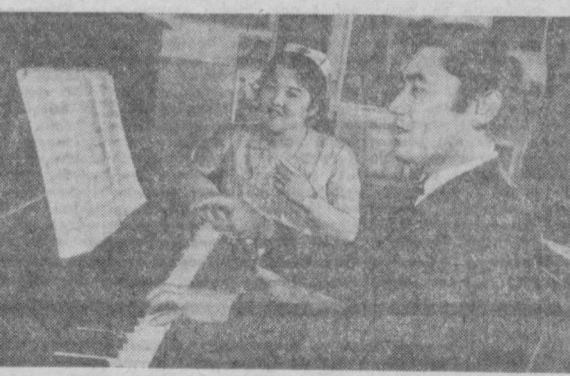
САМАРҚАНД ОБЛАСТИ. Халқ ижодий уйи қошидаги ашула ва рақс ансамбли обалтадаги пахтакорлар, чорвадорлар, ишчи ва хизматчилар орасида ўз қишлоқлари билан но қозонган коллективлар. Утган йили бу коллектив қишлоқ меҳнатчиларига 200 дан ортиқ концерт берди. Ҳозир бу ансамбль солиқтисин Бахтигул Мамаржабова Муиннинг Қамаров журғидаги янги қишлоқ ўрганмоқда.