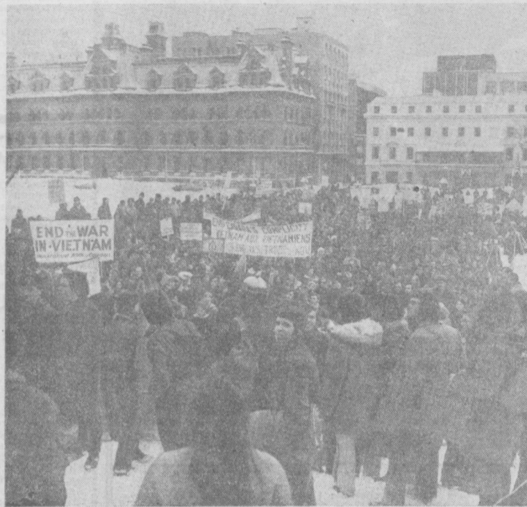
ОТТАВА. Канаданинг пойтахтида урушга қарши сўнгги йиллардаги энг йирик намоёншлардан бири бўлиб ўтди.