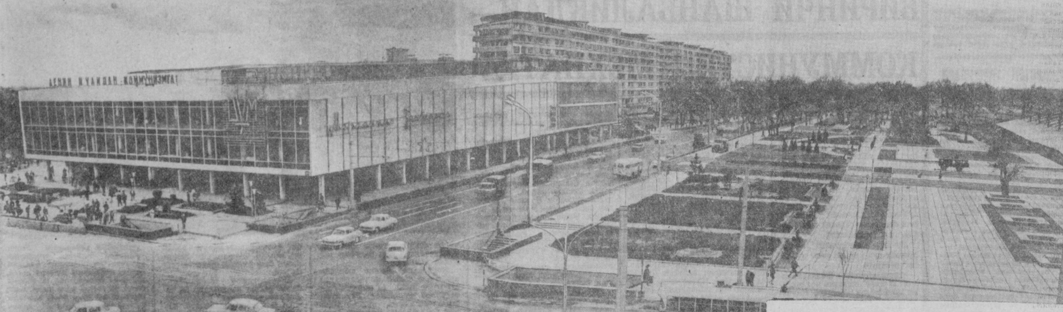
Тошкент йил сайин янгица ҳусн билан яшамоқда. Юбилей йилида ушлаб кўркам бинолар қад кўтарди, янги хиббонлар қурилади. Қад ростлаган В. И. Ленин музейи филмали ҳадемай меҳнатнашларнинг зияратгоҳига айланади. Суратда: шаҳар марказида қуриладиган Ленин хиббонининг кўриниши.

— Қани бўлмас, шпалларни ўрнатайлик. Юринлар, кетдик.