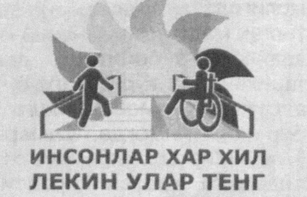
ИНСОНЛАР ХАР ХИЛ ЛЕКИН УЛАР ТЕНГ

ногирон инсонлар ижтимоий фаоллигининг асосий омилдир