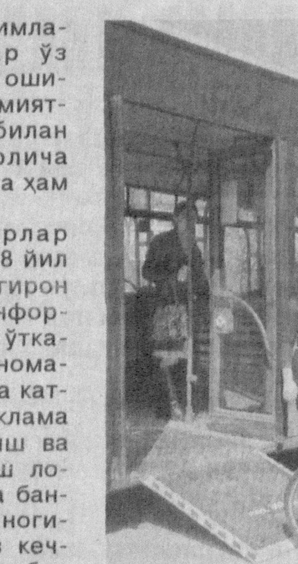
Ўзлари буни қандай қабул қиладилар?

Атрофдагиларнинг ногиронларга муносабатининг яна бир кўриниши — бундай кишиларга гоҳида ачинаш билан қарашдир. Имонияти чекланган кишиларнинг