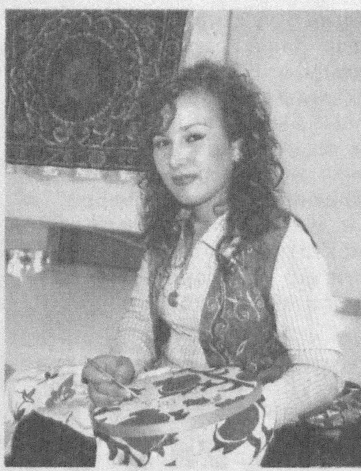
наларига юқори баҳо беришди.

«Ипак иплар жилоси» номи кўрғазманинг очилиш маросими бўлиб ўтди.