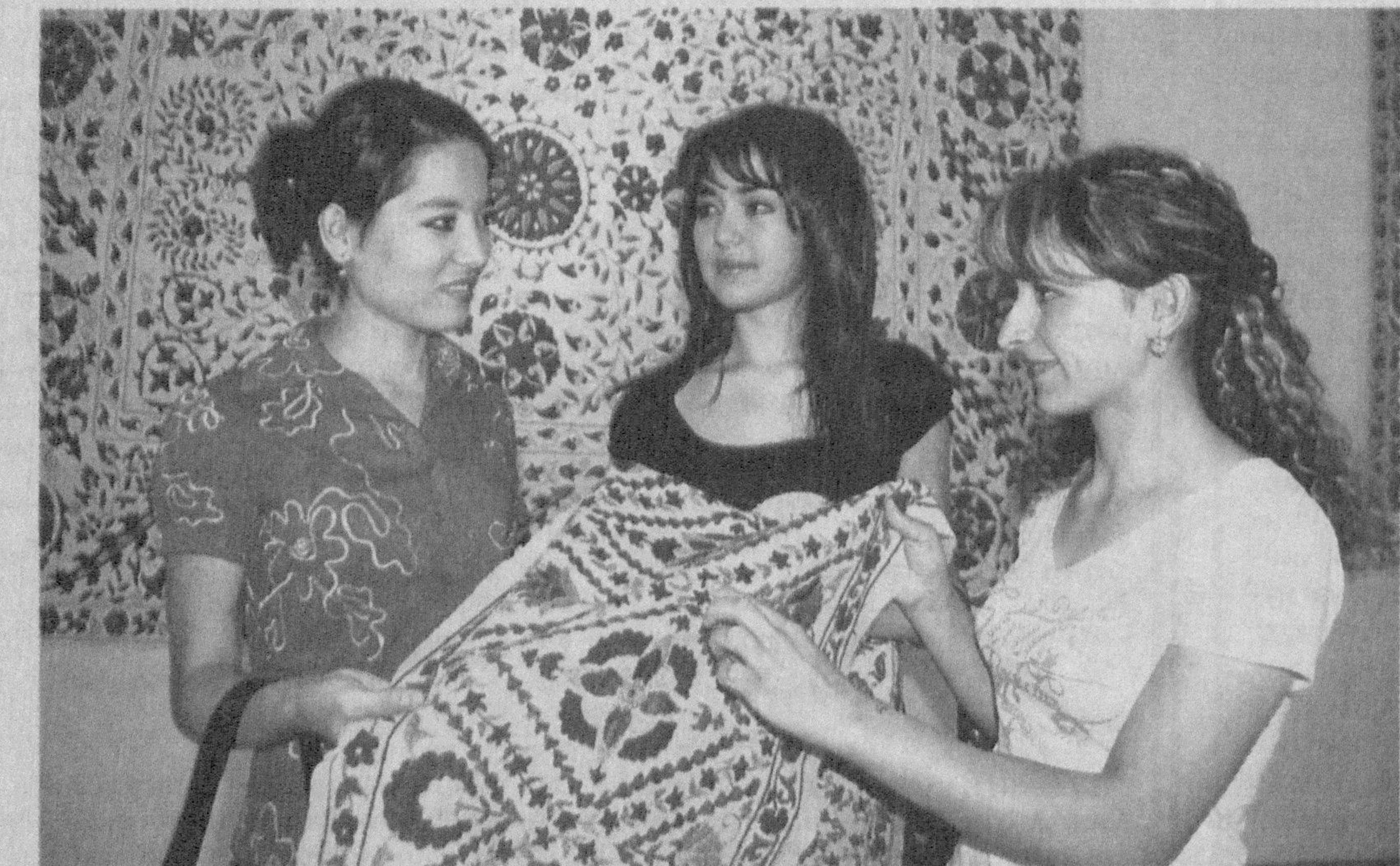
«Зафарнома» асарига ишлаган «Темур тахта» миниятурасида (1467 й.) каштали чодирни ҳам акс эттирган.

Шундан сўнг ёш каштадўзларимизнинг санъат асарлари намойиш этилди.