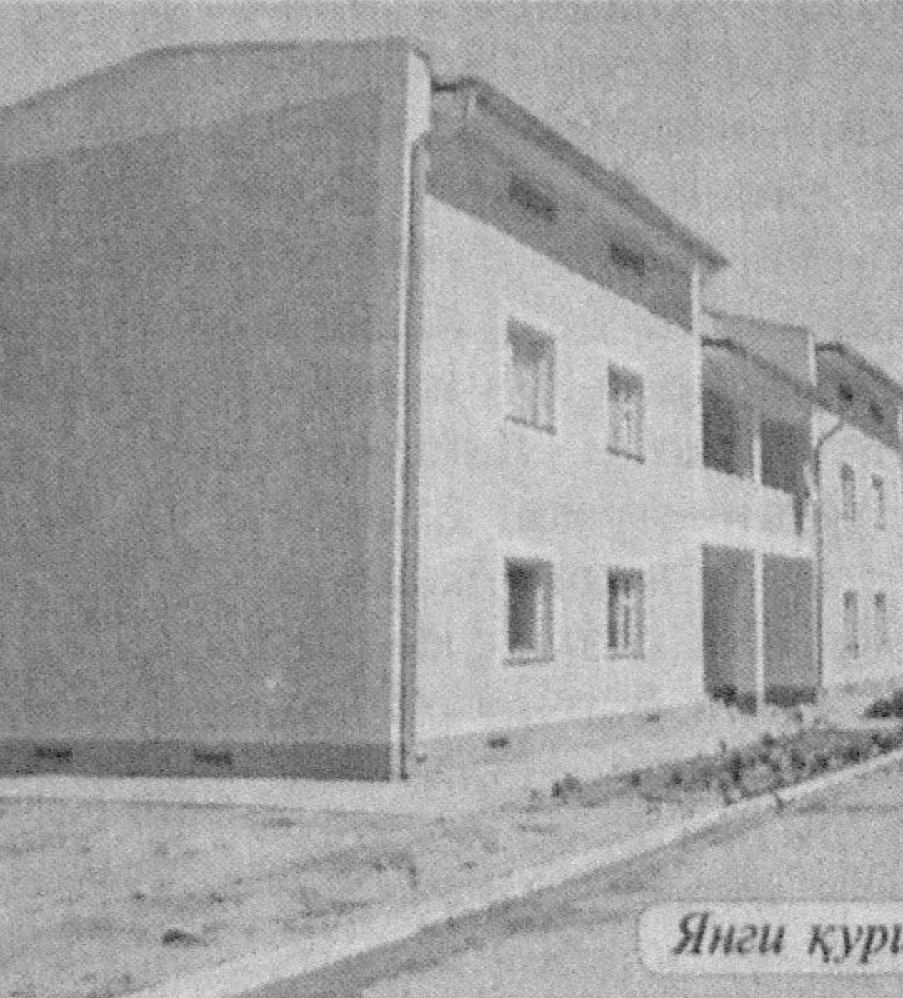
Янги қурилган турар жой бинолари.

қилаётган Заркент шаҳарчасида ҳам кузатиш мумкин. Беш миң киши истиқомат қилаётган ушбу масканда 850 ўринли мактаб, 80 ўринли мактабгача таълим муассасаси, замонавий жиҳозланган шифохона аҳолига хизмат кўрсатмоқда. — Утган йил шаҳарчамизда ҳар бири 8 хонадонга мўлжалланган учта турар жой биноси қурилиб, фойдаланишга топширилди, — дейди Зарминтан қони уй-жой коммунал хўжалиги бўлими бошлиғи Абдуғафур Жонибеков. — Шунингдек, иккунгина замонавий меҳмонхона ҳам ишга туширилди. Бу йил яна 4 шундай уй қурилмоқда. 2 кotteжда эса қурилиш ишлари ниҳоясига етмоқда. Заркентда бу йил 435 ўринли санаят ва сервис касбхона коллежи қад ростлади. Бу ерда шаҳарча ёшлари ҳамда юртимизнинг турли худудларидан келган йиғинокчилар 4 йўналишда тоғ-кон соҳаси мутахассисликлари бўйича касб-хўнар ўрганади. Ғолиб ҲАСАНОВ, ЎЗА мухбири Т.НОРҚУЛОВ (ЎЗА) олган суратлар.