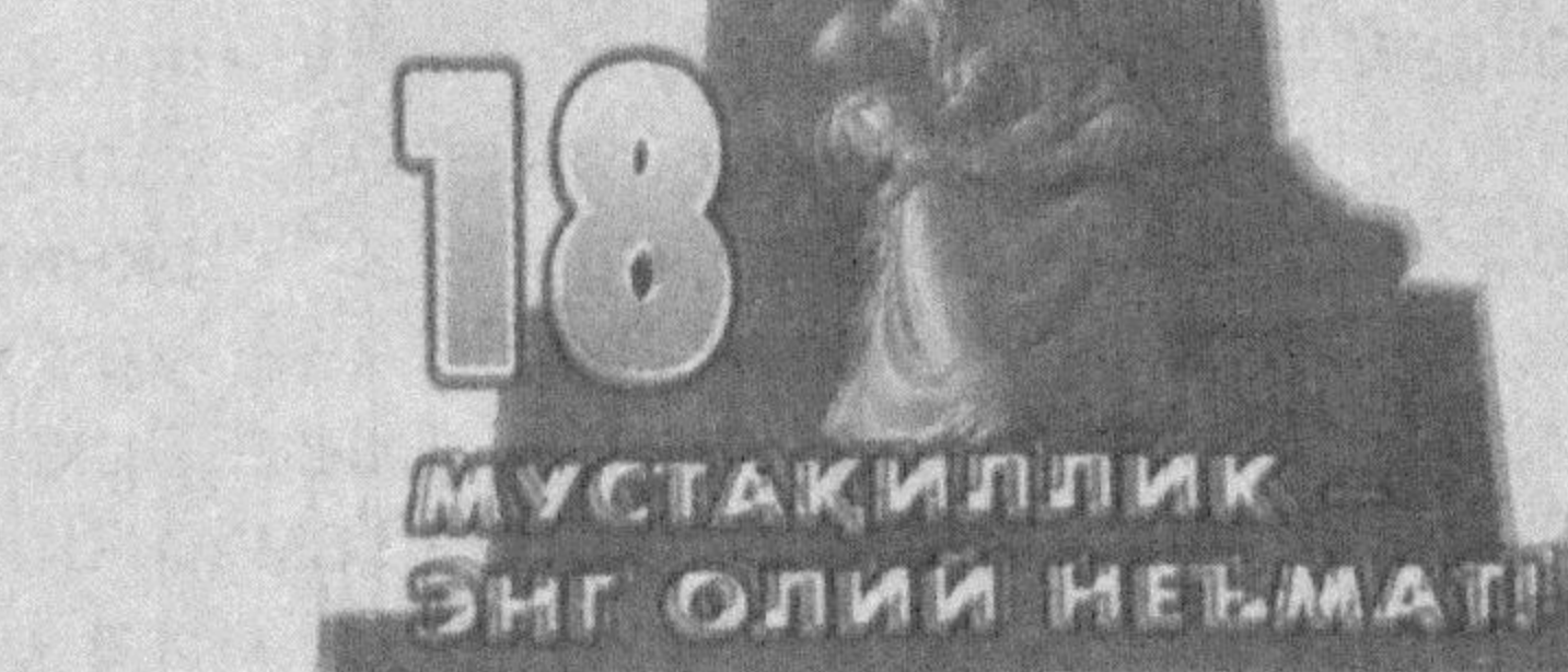
18 МУСТАҚИЛЛИК ЭНГ ОЛИЙ НЕЪМАТ!

Четдан туриб бизга турли хил танлаш пуч тавсияларини ўтказишга қаратилган ҳар қандай уринишлардан воз кечиб, ўз ақл-заковатимизни ишлатиб, ислохотларни изчил ва босқичма-босқич амалга ошириш йўлини танлаганимиз бунда айни мудоаа бўлди. Яъни, бoshкача қилиб айтганда, сирти ялтирок, ичи қалтирок, «шок терапияси»га ўхшаган, бизга номаълум бўлган усулларга берилмасдан, четдан маслаҳатчиларни олиб келмасдан, оқибатини ўйлаб, янги жамият, янги иқтисодиётни қуришда вазиимлик билан, шoшилмасдан сиёсат олиб