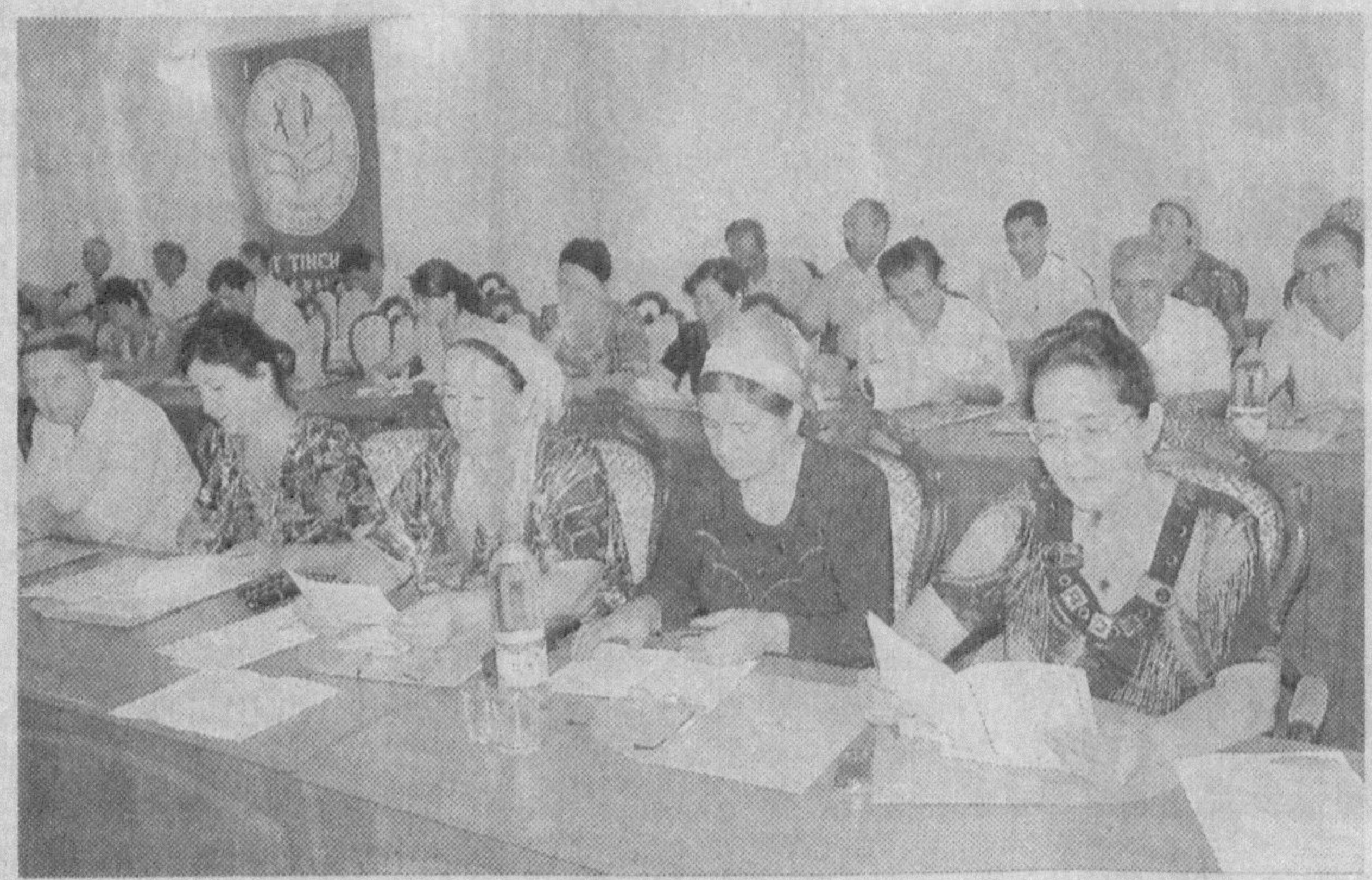
депутатлик гуруҳларимиз кўриб чиқиш назарда тутилмоқда.

2009 йил 3 августда Президентимизнинг «Қишлоқ жойларда уй-жой қурилиши кўламини кенгайтиришга оид қўшимча чора-тадбирлар тўғрисида»ги қарори қабул қилинди. Маазур қарорга мувофиқ, қишлоқ аҳолисининг яшаш шароитини тубдан яхшилаш мақсадида уй-жойларни намунавий лойиҳалар ва ижтимоий объектларни қишлоқ аҳоли пунктлари архитектура-режалаштириш ташкилотларининг бош режалари асосида амалга оши-