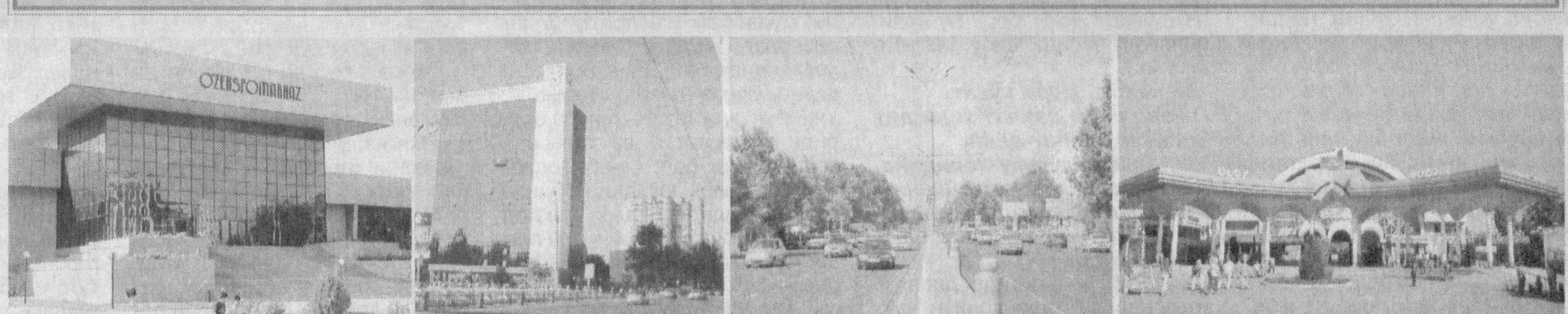
Туманда 39,1 минг нафар нафақадаги киши, иккита Меҳрибонлик уйи, ёрдамчи интернат-мактаб бор

«Қатагон қурбонлари хотираси» музейи 2002 йил 31 августда очилган. Музейдан қатагончилик сиёсати дахшатларини акс эттирган ва бу даврга қатагон қилинган фидоий жўртдошларимизга тегишли ашёлар ҳам урин олган.