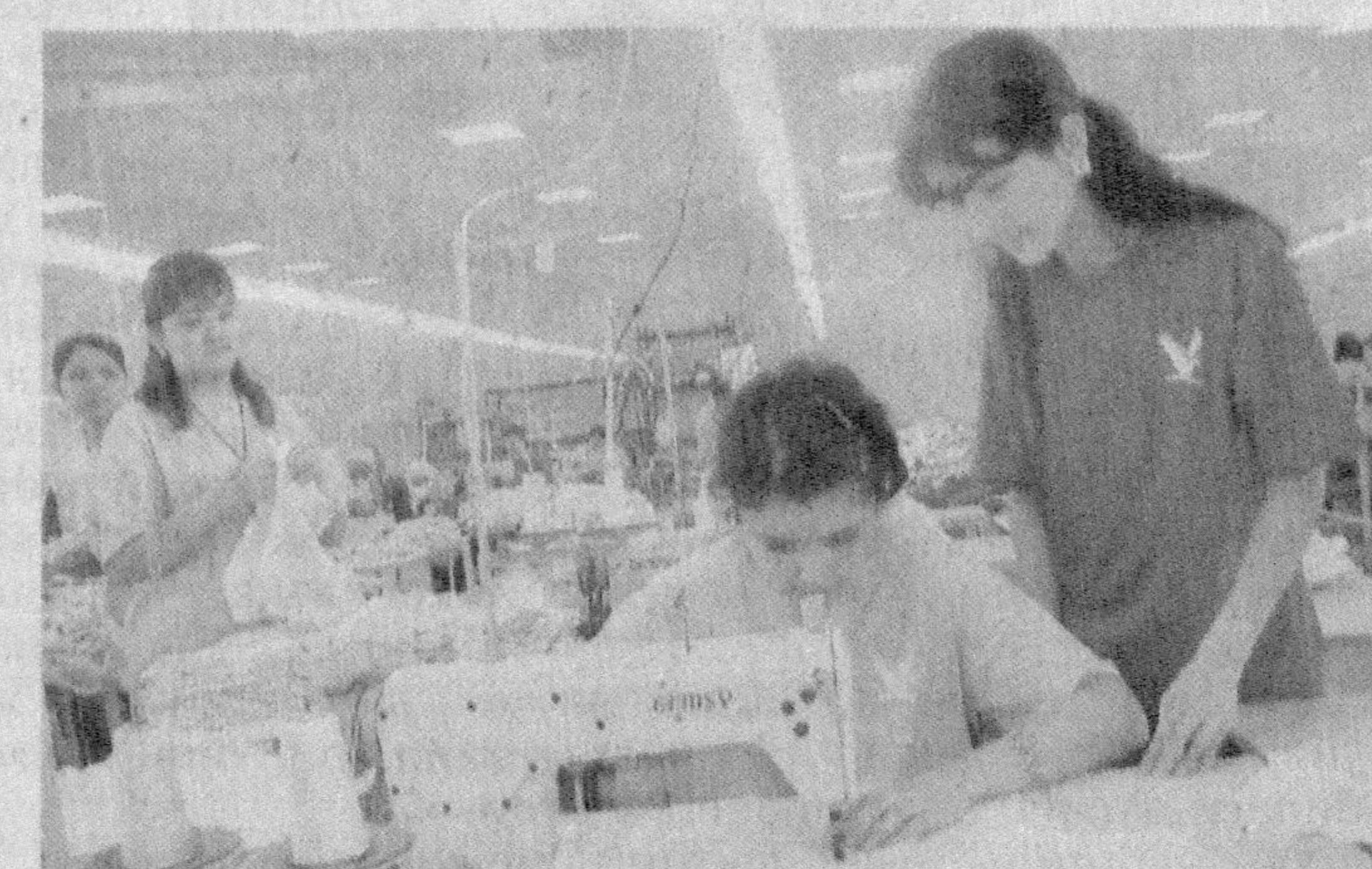
лави йўлга қўйилган. Меҳнат муҳофазаси тўлақонли, яхши шартини таъминлайди. Унга амал қилиш, энг аввало, ўз соғлигини асраб-

олдини олиш мақсадида аҳоли ўртасида меҳнат муҳофазаси масалалари бўйича тушунтириш ишлари олиб борилмоқда. Вилоят ҳудудидаги 4469 та фермер ҳўжаликларидан меҳнатни муҳофазаси қилиш борасида мониторинг ўтказилиб, амалий ёрдамлар кўрсатилди. Бундан ташқари, давлат меҳнат техника инспекторларимиз томонидан касаначилик иш ўринлари яратилган 147 та корхоналардаги 1499 нафар касаначи билан алоҳида тушунтириш иш-