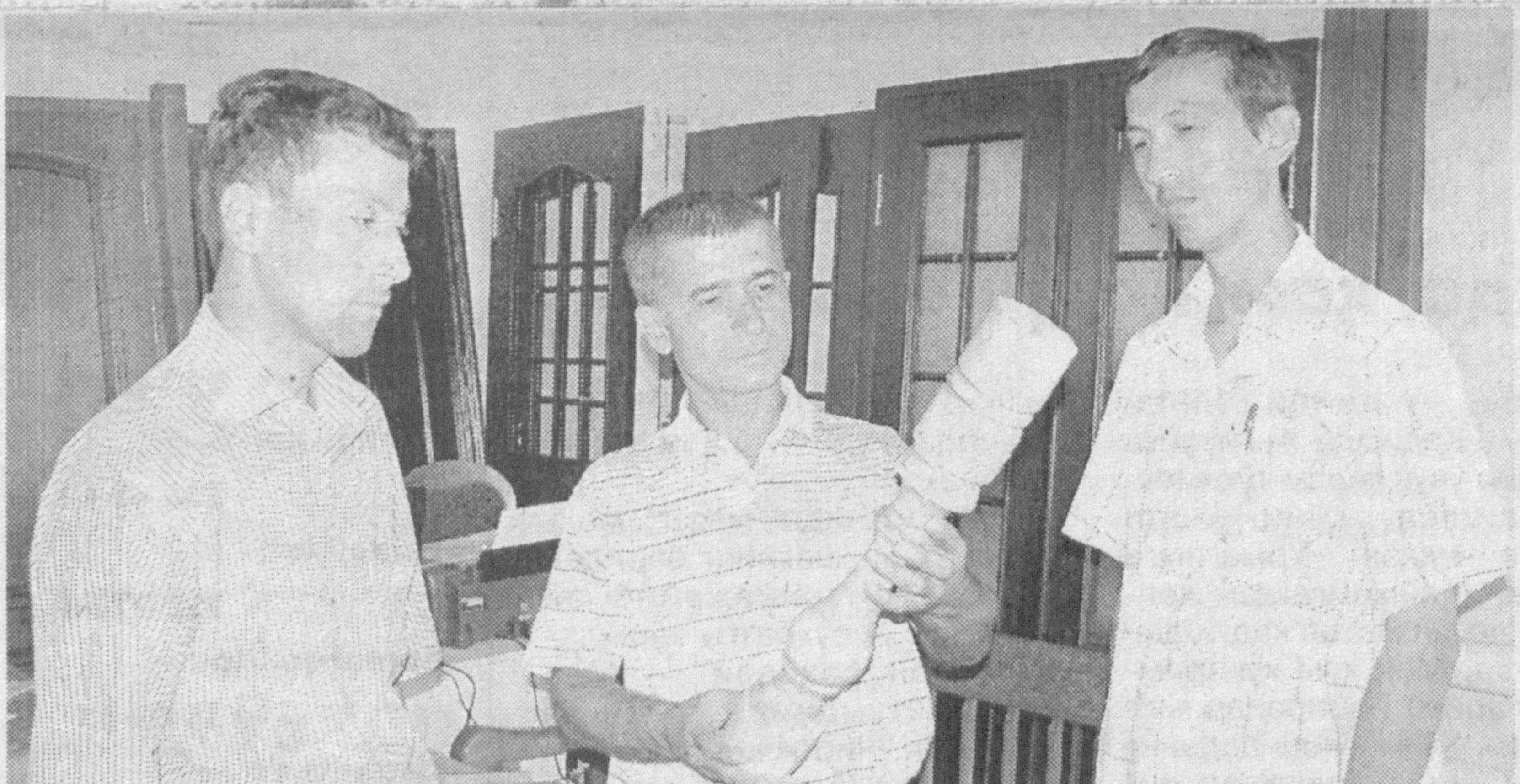
Хивадаги «Хивасервис» маҳсулотларида талабгорлар кун сайин кўпаймоқда. Уттиз турдан зиёд бе-

жирим, арзон, сифатли дурдгорлик ашёлари тайёрланаётган корхона цехларида бугун 50 на-