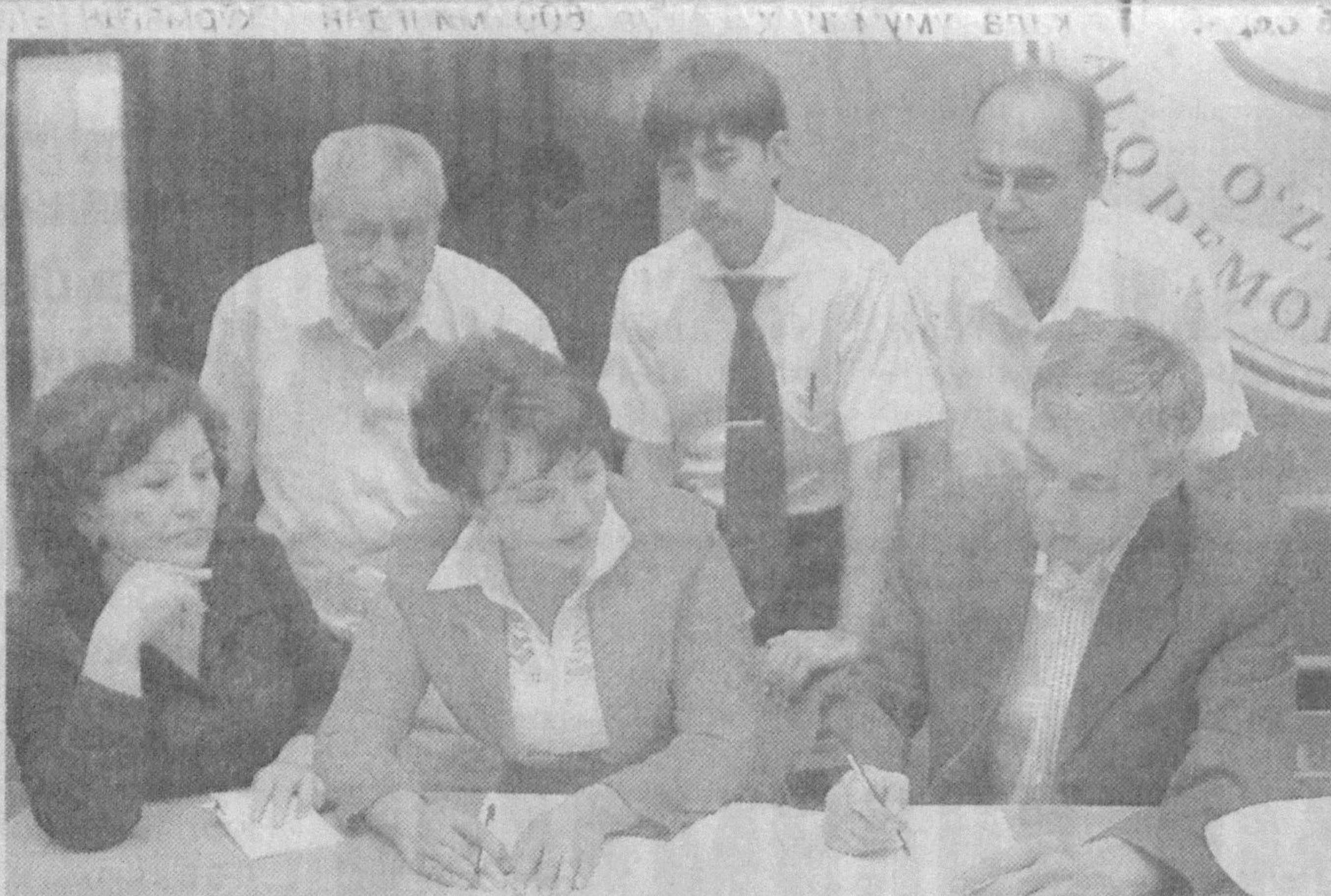
борасида батафсил фикр алмашилди.

Семинар иштирокчилари сайлов кампаниясини ташкил этиш ва уни ўтказиш жараёнида очиллик, ошқоралик таъминлигини таъминлашнинг қонунчилик асослари, демократик сайловларни ўтказишда сиёсий партиялар иштироки