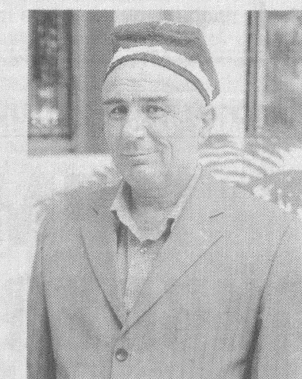
иш тажрибасини ўргатишдан эринмайди.