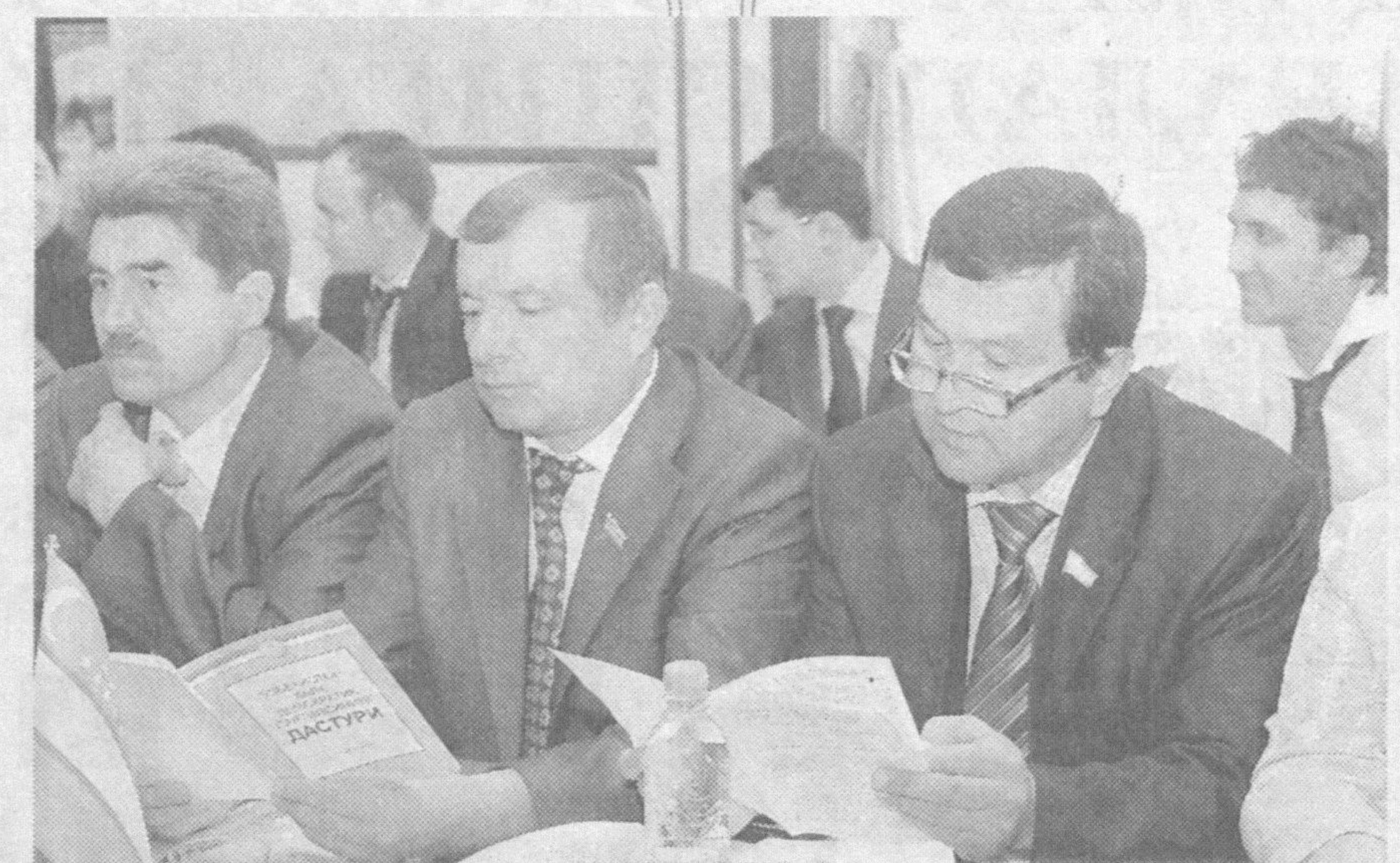
ған Ҳаракат дастурларини маромига етказишда ижтимоий

Бундай дастурларнинг қабул қилиниши ҳар бир минтақавий партия ташкилоти учун катта сиёсий аҳамиятга эга. Шундай бўлса-да, уларга аниқликлар киритиш, такомиллаштириш талаб қилинади. Жумладан, Қорақалпоғистон республика, Самарқанд, Қашқадарё, Навоий ва Сур-