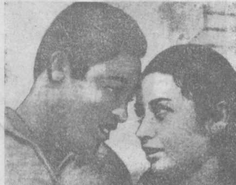
В центре — Доменино Агуста и Хосе Джермано.

В Рио «тиффози» устроили молодому тандему встречу, какой народ ли удостоивался такой знаменитый футболист.