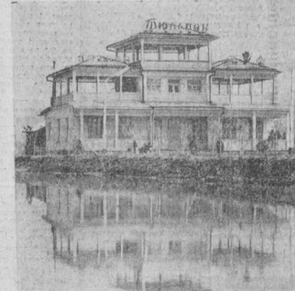
ТАШКЕНТСКАЯ ОБЛАСТЬ. В колхозе «Политотдел» Верхнеирчинского района открылась новая столовая-кабана «Тюльпан».

Сев еще одной сельскохозяйственной культуры — свеклы начали хозяйства Узбекистана. Земледельцы закладывают в почву семена распространенного сорта столовой свеклы «бордо», дающей урожай до трехсот центнеров. Свекле отведено в республике почти 40 тысяч гектаров.