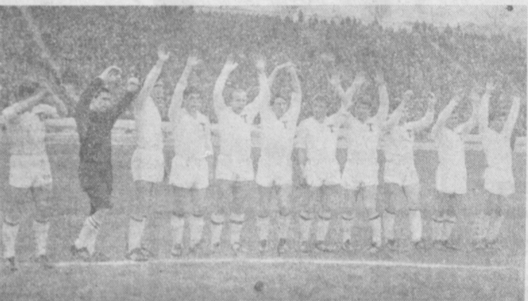
Вчера московские торпедовцы, которых вы видите на снимке фотокорреспондента Н. Надеждина, встретились в дополнительном третьем матче на Кубок кубков с футболистами «Кардифф-сити» (Уэльс).