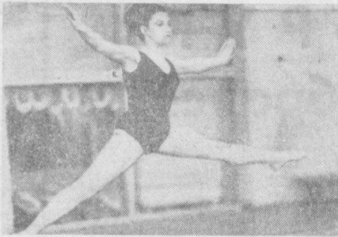
балла. Винер отстала от подруги по команде на две десятых балла.

досталось Народицкой (31,45 балла). Закончилось первенство республиканскими показательными выступлениями самых юных гимнасток, которых тепло приветствовали зрители. Соревнования закончены. Спущен флаг первенства. А восемь лучших гимнасток Узбекистана отправятся на всесоюзные состязания в Ленинград, которые начнутся 17 апреля.