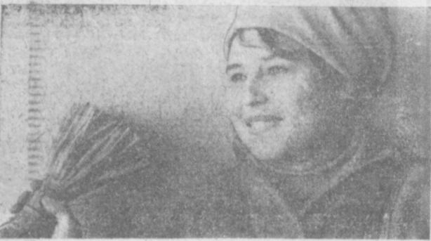
ЭТА ДЕВУШКА — ПЕРЕДОВОЙ МАЛЯР НОВОКУЗНЕЦКОГО СТРОИТЕЛЬНО-МОНТАЖНОГО ПОЕЗДА. ВМЕСТЕ СО СВОИМИ ТОВАРИЩАМИ ОНА ВОЗВОДИТ ДОМА В МИКРОРАЙОНЕ Ц-4. КАЧЕСТВО ЕЕ РАБОТЫ ВСЕГДА ПРИЗНАЕТСЯ ОТЛИЧНЫМ.