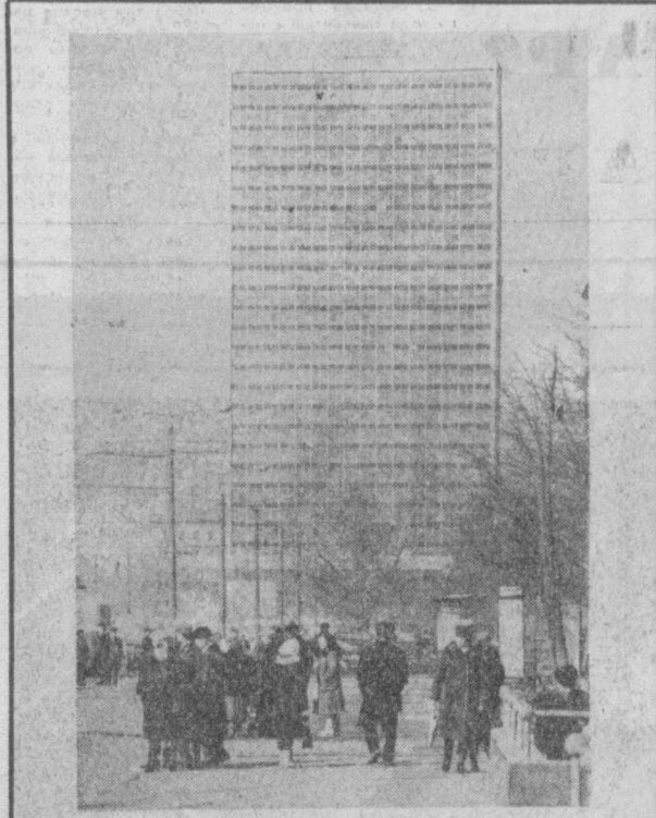
МОСКВА СЕГОДНЯ. Заманчивается строительство высотного здания института «Гидропроект» на развилке Ленинградского и Волоколамского проспектов.

Намечены и другие мероприятия, направленные на лучшую организацию летнего отдыха детей. Всего в пионерских лагерях за лето отдохнет более 60 тысяч детей.