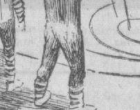
рис. З. Лелявской.

ва, заведующий отделом культуры Октябрьского районного комитета, принимает решение о всех предстоящих мероприятиях.