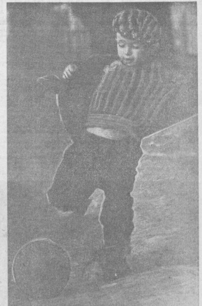
ХОЧУ БЫТЬ ФЕДОТОВЫМ. Фотохуд Н. Надеждина.