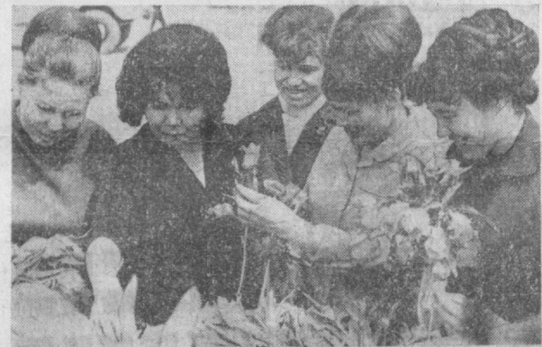
Алеют, сверкают на солнце огненно-красные тюльпаны. И, привлеченные их красотой, все — и стар, и млад — спешат к цветочным лавильонам: — Дайте, пожалуйста, букетик.