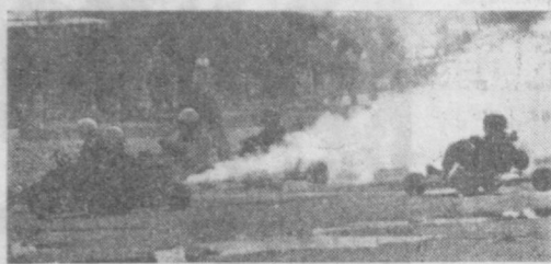
В минувшее воскресенье в командном зачете первое место завоевали досафранцы Ферганы, а ташкентские маринисты остались на втором месте. На снимке: дан старт состязаниям.