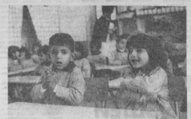
КУБЕРТ. Семь лет назад страна обрела независимость, положение юнец многолетнему английскому владению. С первых дней самостоятельного развития молодое государство обращает большое внимание на воспитание подрастающего поколения. В стране открыто несколько десятков детских садов — невозможная роскошь в колониальные времена. На снимке: ребята из детского сада района Дасман.

НЬЮ-ЙОРК. Здесь состоялась торжественная церемония поднятия Государственного флага Маврикия — нового члена Организации Объединенных Наций. С приветственной речью выступил генеральный секретарь ООН У Тан. Затем на одном из флагштоков здания ООН был поднят Государственный флаг страны, ставшей 124-м членом этой организации.