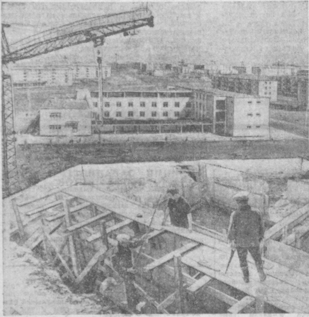
Грузия обещала построить в Ташкенте 22500 квадратных метров жилья. Около 18 тысяч жилой площади они уже успешно сдали. На снимке: завод закладывает 56-квартирный жилой дом.