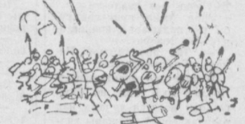
— Кончаем съемку?