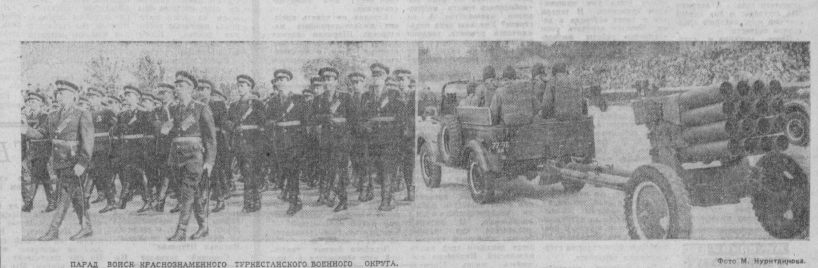
ПАРАД ВОЙСК КРАСНОЗНАМЕННОГО ТУРКЕСТАНСКОГО ВОЕННОГО ОКРУГА.