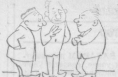
— Сообразим на троих?!