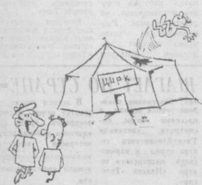
— Пойдем быстрее, уже акробаты выступают!