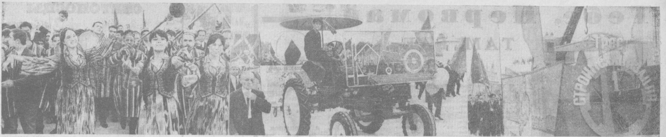
ДЕМОНСТРАЦИЯ ТРУДЯЩИХСЯ СТОЛИЦЫ УЗБЕКИСТАНА.