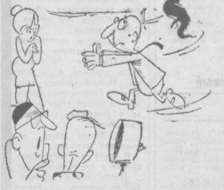
— Из-за ветра мы никак не можем снять его в роли молодого героя!