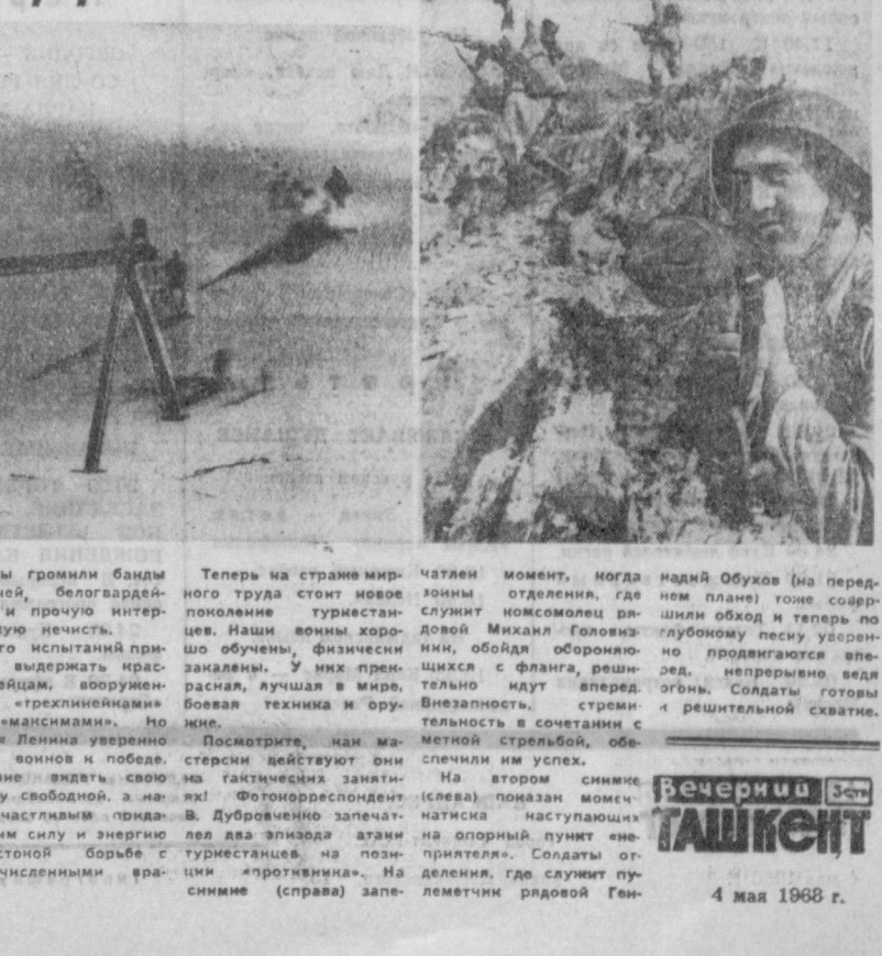
4 мая 1968 г.