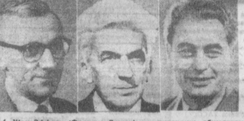
4. Жан Эффель (Франсуа Лежен) — художник, общественный деятель (Франция). 5. Эндре Шик — ученый, общественный деятель (Венгерская Народная Республика). 6. Яорис Ивено — кинорежиссер, общественный деятель (Нидерланды).