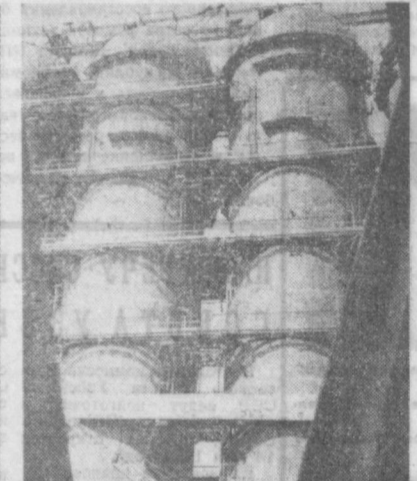
Шесть с половиной тысяч тонн высокоортного чугуна будет ежедневно давать новая доменная печь Череповецкого металлургического завода. Домна полезным объемом 2700 кубических метров будет одной из самых производительных в мире. Первый чугун она даст уже в этом году. Конструкция домны предусматривает полную автоматизацию подачи сырья, механизацию других операций. На снимке: комплекс воздушонагревателей новой доменной печи.