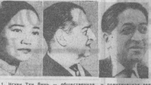
1. Нгуен Тхи Динь — общественная и политическая деятельница (Южный Вьетнам). 2. Хорхе Саламеа Борда — писатель, общественный деятель (Колумбия). 3. Ромеш Чандра — генеральный секретарь Всемирного Совета Мира (Индия).