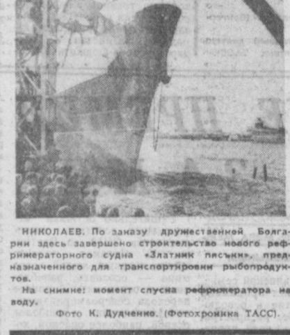
НИКОЛАЕВ. По заказу дружественной Болгарии здесь завершено строительство нового рефрижераторного судна «Златник пещин», предназначенного для транспортировки рыбопродуктов. На снимке: момент спуска рефрижератора на воду.