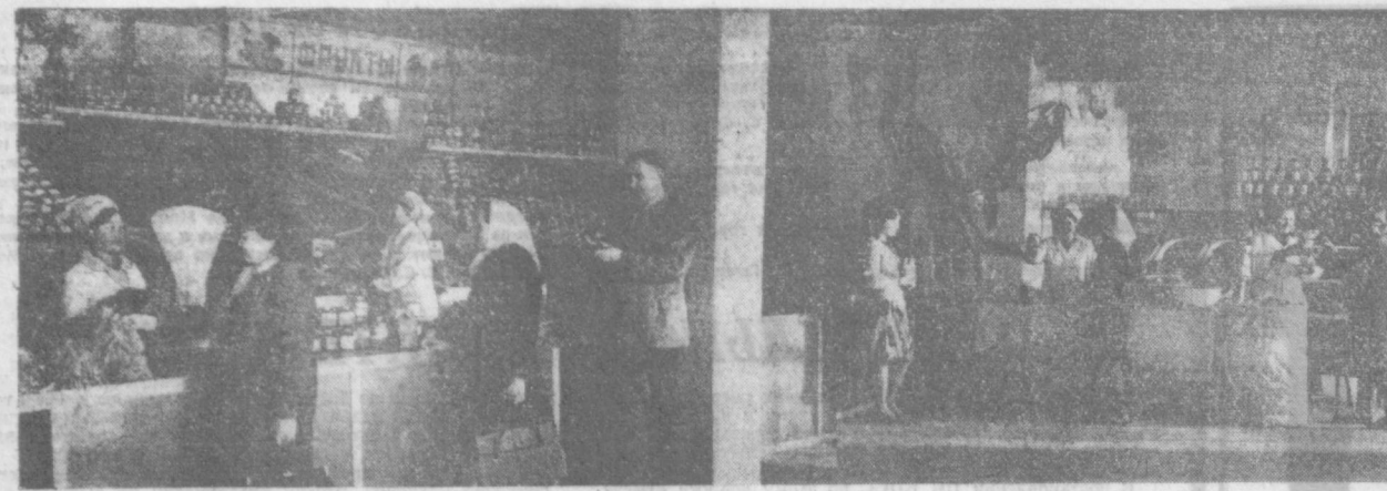
Предмайский подарок — новый плодоягодный магазин, открытый на улице Фархадской Чиланзара. Кроме овощей и фруктов, здесь также можно приобрести мясные и гастрономические изделия. На снимках: в магазине.