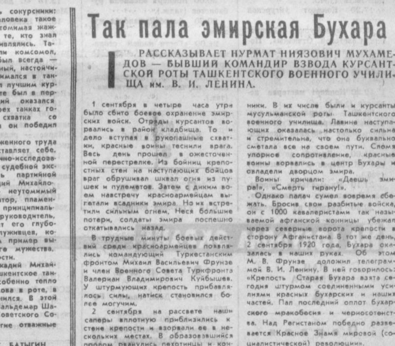
Вечерний Зен Ташкент