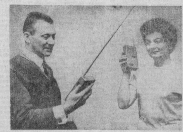
Новый радиотелефон «Эк» польского производства. Небольшой размер и вес делают его чрезвычайно удобным в употреблении. Дальность работы — 3 километра. Одной батареей хватает на 10 часов бесперебойной эксплуатации.

На основных фронтах Южного Вьетнама Армия освобождения при поддержке партизанских соединений ведет крупное наступление против американских интервентов и их наемников. Наступательные операции патриотических сил развернулись одновременно от дельты Меконга до демилитаризованной зоны. Наиболее ожесточенные и кровопролитные бои идут в столице Южного Вьетнама и ее окрестностях. Они продолжаются и днем, и ночью. Еще две-три недели тому назад американское командование хвастливо заявляло, что Народные вооруженные силы освобождения Южного Вьетнама «утратили инициативу», что нового наступления Вьетконга можно не опасаться. Столбчатая американско-сайгонская группировка в колее провинции, окружающих Сайгон, проводила операцию под названием «Полная победа». Но обещанной победы не последовало. Удары патриотов посылались на интервентов со всех сторон. Агрессоров и их марионеток бьют в самом Сайгоне. «Наша армия и народ, — отмечается в опубликованном на днях обращении ЦК НФО Южного Вьетнама ко всем соотечественникам и бой-