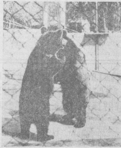
ЗДОРОВО, ПОТАПЫЧИ