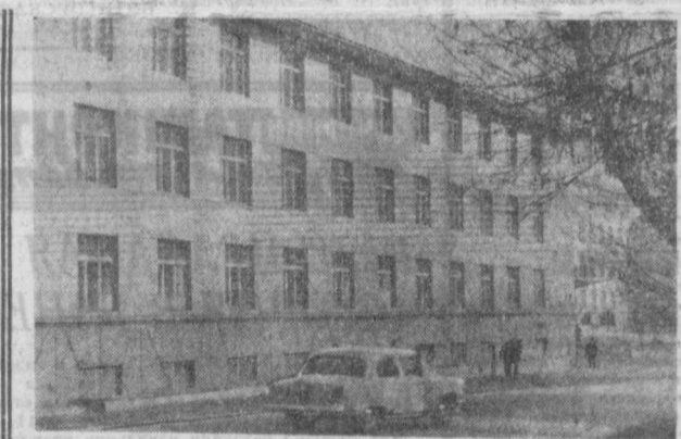
ТАШКЕНТ СЕГОДНЯ. Новый учебный корпус заочного отделения ТИИИМСХ.

В ПРОШЕДШЕЕ воскресенье городской парк им. М. Горького принимал гостей с уютом. В этот день пионеры школ Куйбышевского района проводили здесь свой традиционный День пионерской организации имени В. И. Ленина. На центральной площадке парка состоялась торжественная линейка. Юных ленинцев горячо поздравил директор завода «Узбексельмаш» А. Г. Стыпайло, который в этот день принимал участие в празднике.