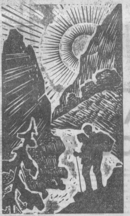
В ГОРАХ УЗБЕКИСТАНА. Рис. И. Цыганова.