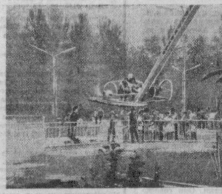
Здесь все увлекательно: и стремительный взлет на начеллях, и полет на самолете, и катание на лодке по бассейну, и веселая карусель. Солнце, Зелень. Звонкие детские голоса. Это парк имени З. Тельмана. Приблизительно так выглядит сегодня и многие другие парки города. Они готовы гостеприимно встретить ту детвору, которая не уезжает на лето в пионерские лагеря, а остается отдыхать дома.

Здесь все увлекательно: и стремительный взлет на начеллях, и полет на самолете, и катание на лодке по бассейну, и веселая карусель. Солнце, Зелень. Звонкие детские голоса. Это парк имени З. Тельмана. Приблизительно так выглядит сегодня и многие другие парки города. Они готовы гостеприимно встретить ту детвору, которая не уезжает на лето в пионерские лагеря, а остается отдыхать дома.