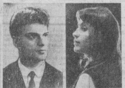
Советские музыканты — лауреаты Международного юниорского пианистского имени королевы Елизаветы в Брюсселе: