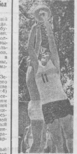
КОМУ ДОСТАНЕТСЯ МЯЧ?