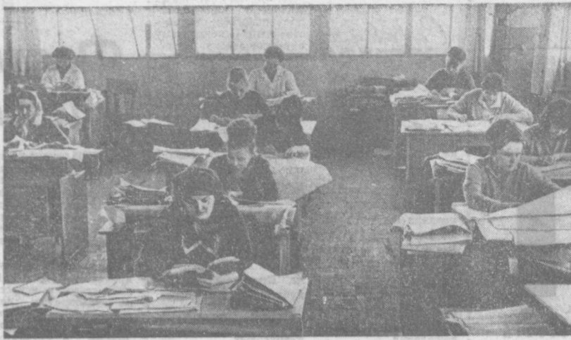
В этом большом помещении — конструкторское бюро Ташкентского электротехнического завода. Здесь разрабатывается техническая документация на изготовление щитовых устройств для электростанций и подстанций высокого напряжения. Работа конструктора требует внимательности и глубоких знаний по основам электротехники и самое главное — всегда нужно быть в курсе последних достижений в этой области. Вот поэтому на каждом рабочем месте рядом с чертежами и планами лежит справочная литература. Подчас она бывает необходима.