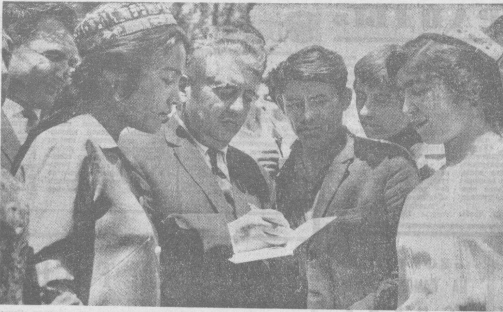
На Театральной площади состоялось открытие книжного базара таджикских писателей. НА СНИМКЕ: писатель Мирзо Турсунзаде дает автографы.

Книгу У. Ражаба «Шоги или Ходи» выпустило издательство «Детская литература» в Москве.